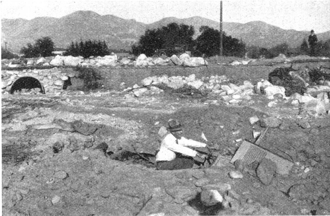
Matériaux déposés par le torrent sur la route et ses abords. A l'arrière-plan: montagnes dénudées par l'incendie.