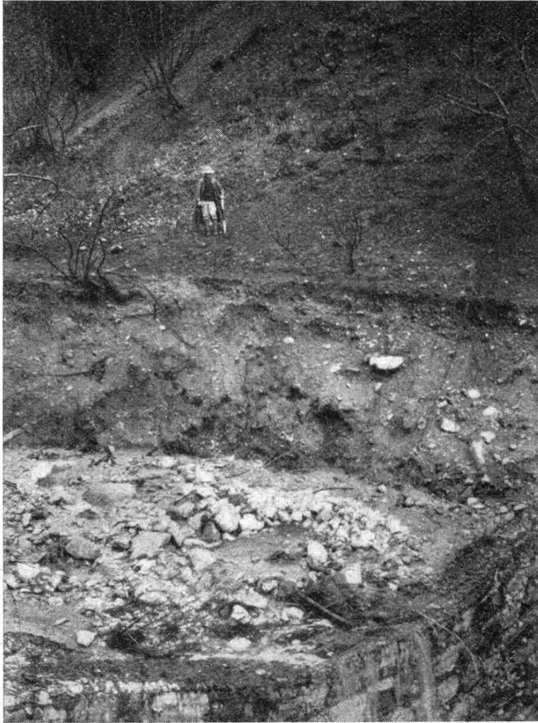
Un affluent du Verdugo Creek. Les buissons ont été incendiés.

nelles sont d'au moins 75 cm, que l'on trouve la vraie forêt composée de : Pinus Coulteri , P. ponderosa , P. Lambertiana , P. monticola , Pseudotsuga macrocarpa , Abies concolor , Libocedrus decurrens , des chênes et d'autres espèces.