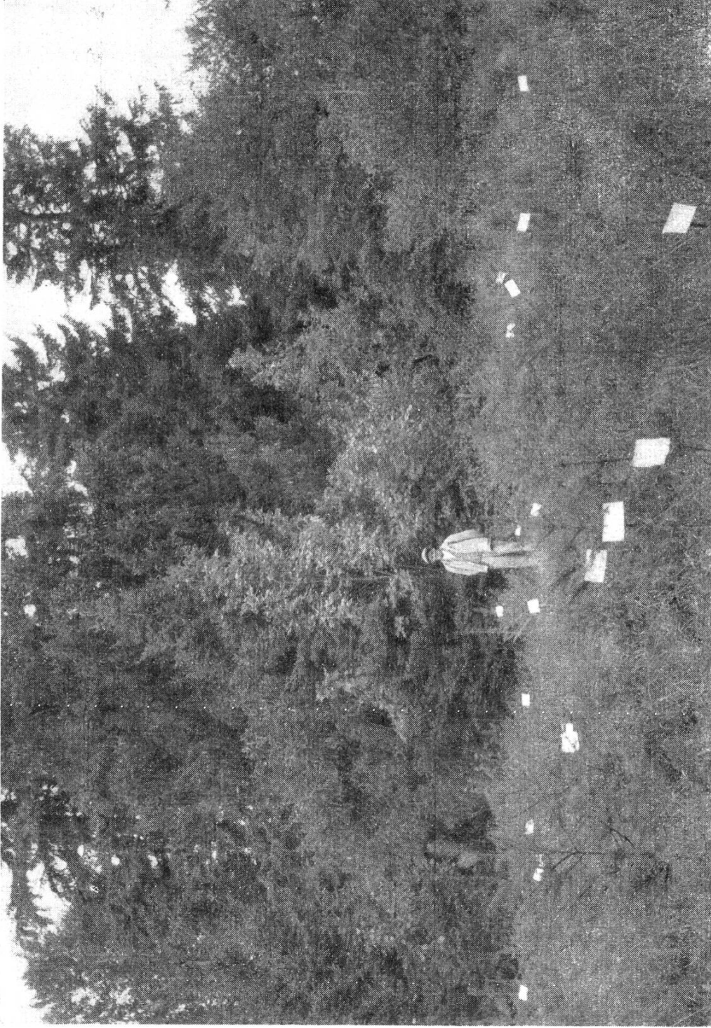
Plantation de douglas verts décimée par les chevreuils.

Boisement des Prés Brunets, sur Ballaigues (Vaud).