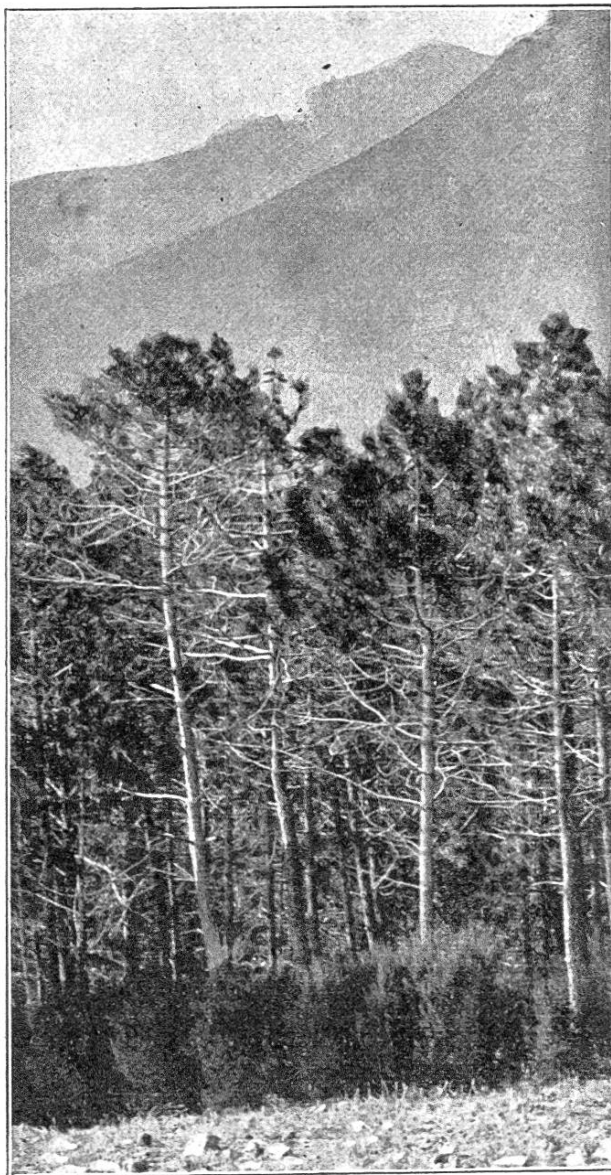
Bestand mit Unterholz längs einer Feuer-schneise.

Im Staatswald hat man heute Mittel, um der schrecklichen Feuergefahr zu wehren. Über die von Osten nach Westen, rechtwinklig zur hauptsächlichlichen Windrichtung streichenden Höhenzüge hat man 20 bis 50 m breite Feuer-schneisen gelegt und erhält diese, einige Eichen ausgenommen, völlig kahl. So gelingt es, die Waldbrände zu lokalisieren. Die Schneisen dienen als Verteidigungslinien, von denen aus oft mit Gegenfeuer gearbeitet wird. Ein Gesetz von 1893 verbietet jedes Feueranmachen in den 4 Sommermonaten und verpflichtet die Privaten, längs dem Staatswald Schneisen zu unterhalten. Dasselbe geschieht längs den Bahnlagen. Über das ganze Estérel sind 9 Forst-