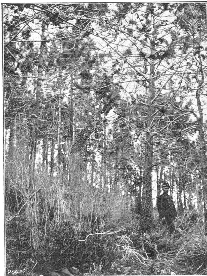
Bestand, 3 Jahre nach Abbrennen des Unterholzes.

Es bot sich uns letztes Frühjahr Gelegenheit, dieses Waldland