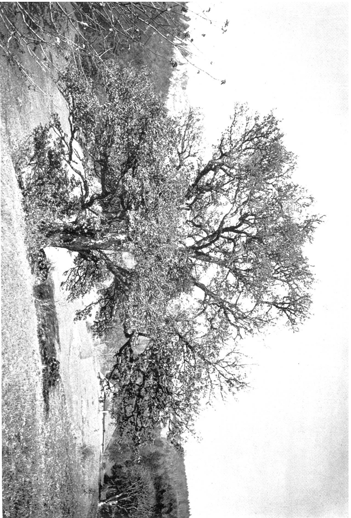
Der große Feldahorn auf der Teuffelenweid zu Altiswyl.