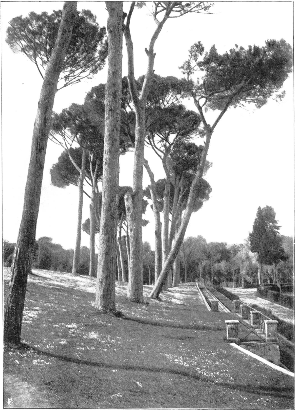
Pinien im Park der Villa Borghese zu Rom.