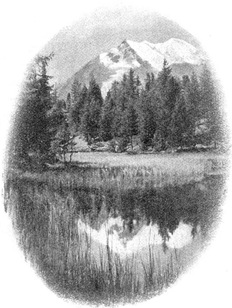
Fig. 3. Grächener Bergsee, umgeben mit Fichten- und Urvenwald.

Dr. M. Mikli unterscheidet die subarktische und die alpine Urvenrasse. Erstere hat eine dünnere Samenschale, keimt rascher, die Keimlinge sind