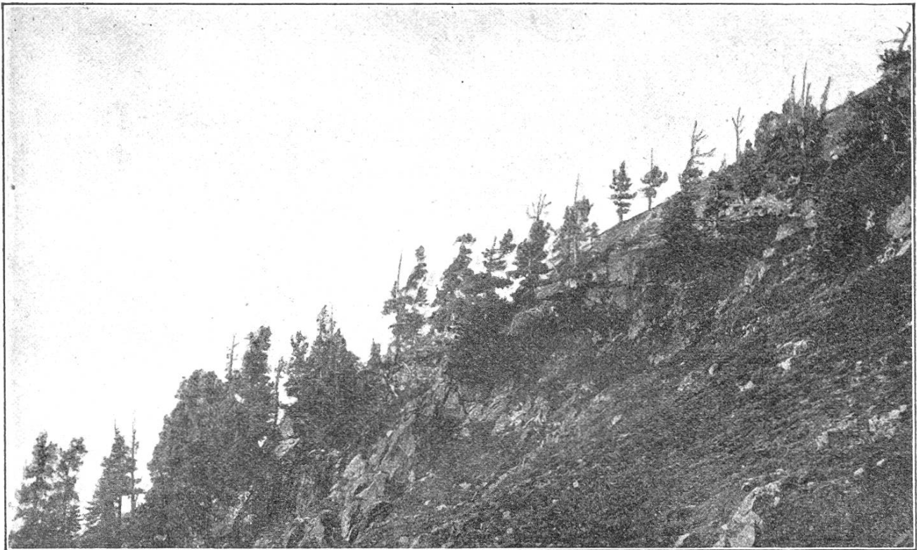
Fig. 2. Pionierreihen der Urve am Hang südöstlich Sertig-Dörfli (rechte Talseite), zirka 2050—2150 m ü. M.

Wenn die Urve im Jura und im Mittelland bis auf 300 m ü. M. hinunter künstlich eingebracht werden kann und gut gedeiht, so zeigt das, daß ihr das Klima keine Schranke stellt. Wo sie sich nicht hält, erliegt sie im Kampf mit raschwüchsigen Holzarten.