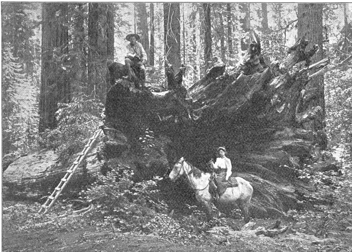
Fig. 1. Der Wurzelstock einer Wellingtonie im nördlichen Calaveras Hain, Kalifornien.

Bevölkerung von Kalifornien, und namentlich die 500 Frauen des „Kalifornia Klub“, haben mehr als neun Jahre lang gearbeitet, um die Regierung für jenen wunderbaren Hain der „Großen Bäume“ zu interessieren. Endlich sind im letzten Jahr ihre Bemühungen von Erfolg gekrönt worden; am 8. Februar 1909 hat Präsident Roosevelt eine bezügliche, vom Senat und vom Abgeordnetenhaus angenommene Bill unterzeichnet. Dieses Gesetz nimmt die Erwerbung des privaten Wellingtonien-Hains durch den Staat in Aussicht. Die Regierung stellte jedoch keine Vermittel zum Ankauf der „Big trees“ von Calaveras zur Verfügung,