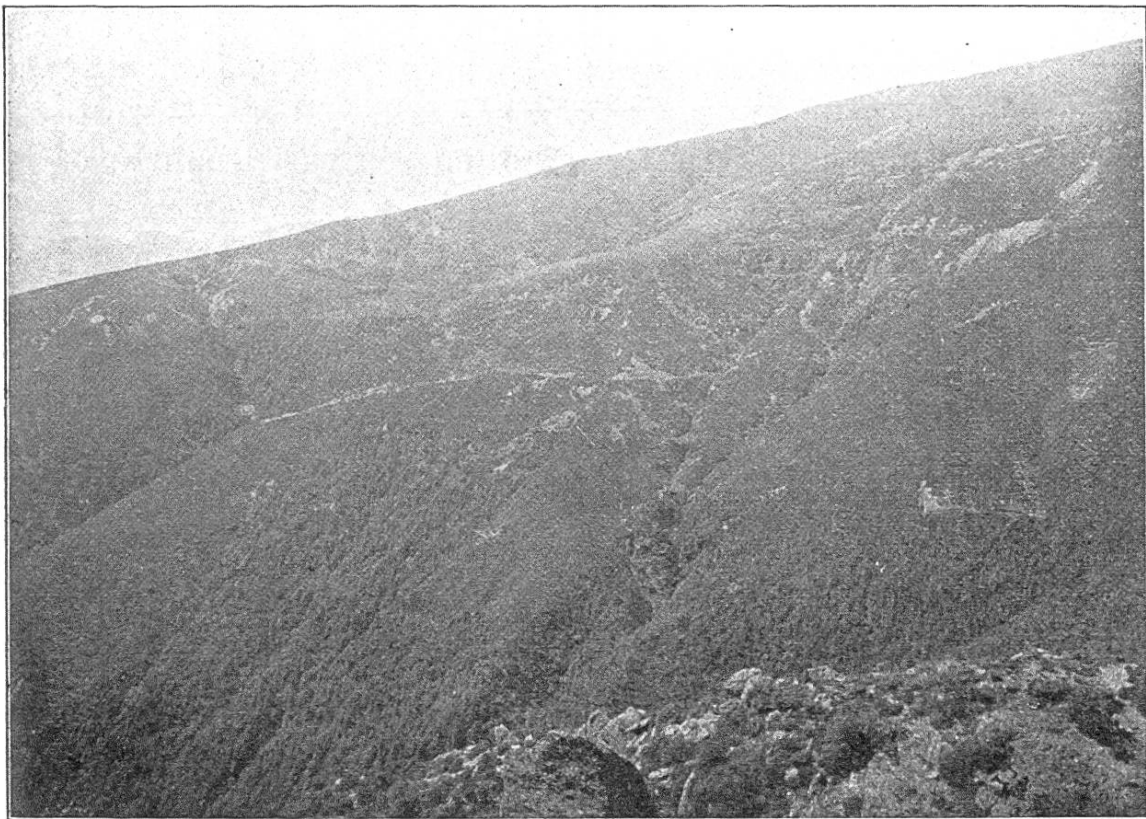
Fig. 3. Oberstes Einzugsgebiet des Bidognotales, Seitental des Val Colla.

richtigen Begriff von der Bedeutung der hier ausgeführten forstlichen Arbeiten zu verschaffen. So stieg man denn am Morgen des 20. Augusts von Tesserete an der rechten Seite des Haupttales nach Bidogno empor und weiter, den Einbiegungen der Seitentäler folgend, bis in den innern Teil des Val Colla. In Maglio, dem ehemaligen Eisenhammer, der einst Veranlassung zu großartigen Walddewastationen gegeben hatte, wurde Quartier bezogen und am nächsten Vormittag noch eine Exkursion auf dem Gebiet der Gemeinde Bogno, zu hinterst im Haupttal, unternommen.