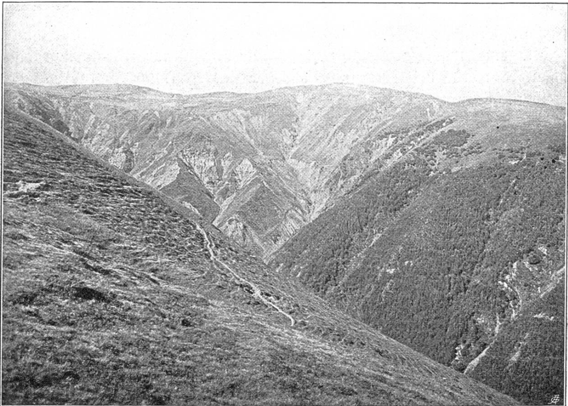
Fig. 4. Innerer Teil des Scaregliatales, Seitental des Val Colla.

Der Bund beteiligte sich an den Gesamtkosten von Fr. 480,000 mit Fr. 266,000, oder durchschnittlich 55\frac{1}{2}\% , der Kanton mit Fr. 90,000 oder 20%, so daß den Patriziati (Burggemeinden) als Besitzerinnen