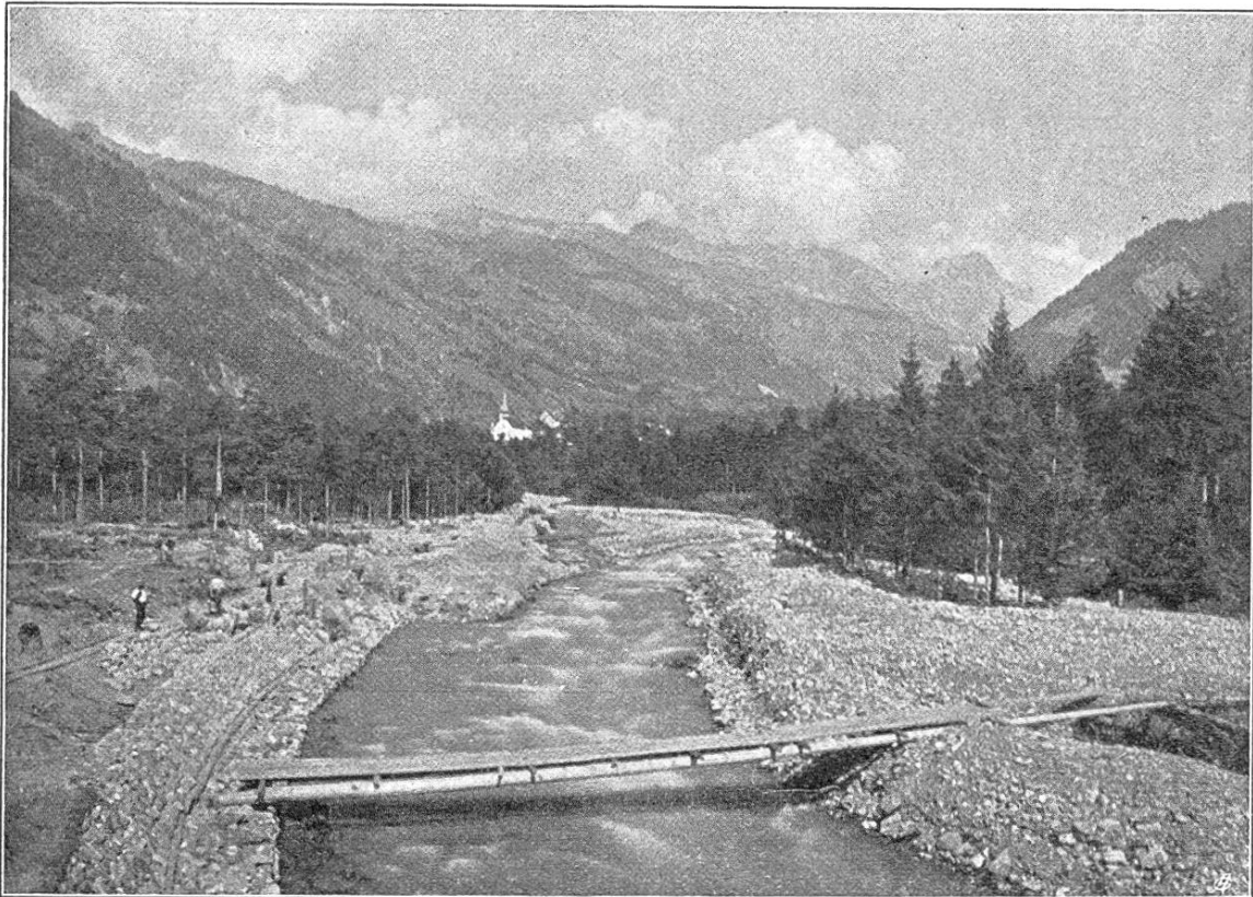
Fig. 1. Wiederherstellung der Uferversicherungen am Schächenbach oberhalb der Brücke bei Schattdorf.

Freitag den 19. August. Begünstigt von anhaltend prächtigem