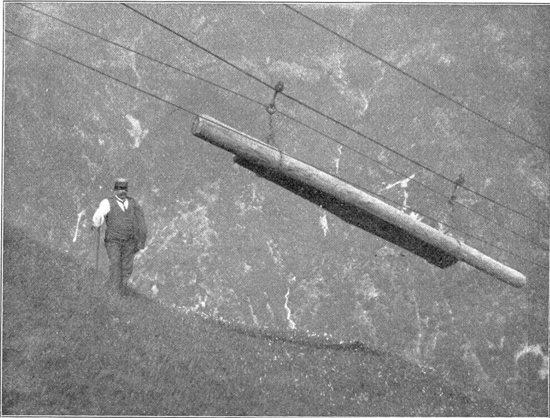
Fig. 3. Drahtseilrieße der Gemeinde Mesocco. — Transport von Langholz.

Beide Riesen sind seither im Betrieb; plangemäß werden jedes Jahr in der entlegenen Albionasca die Schläge geführt und das Bau-, Sag- und Brennholz wird mit verhältnismäßig geringen Kosten nach Roveredo transportiert.