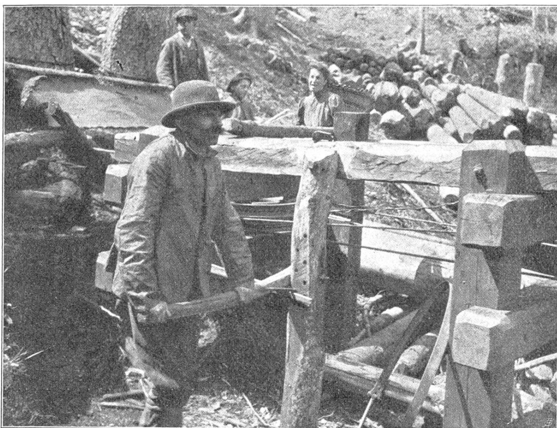
Fig. 1. Drahtseilriese der Gemeinde Mesocco. — Bremsvorrichtung.

Unser Bestreben war daher, an Stelle der für einmalige Nutzungen durch die Holzhändler angelegten Drahtseilriesen, so viel als tunlich