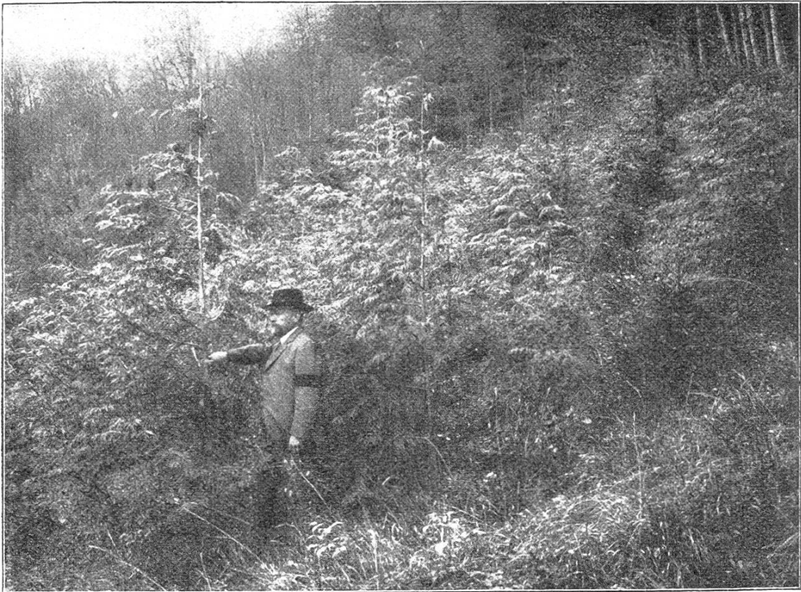
Abb. 1. Thuja gigantea mit Picea Omorica in Marschlins.

Von der Forstverwaltung der Stadt Murten erhielt das Oberforstinspektorat von einer der drei japanischen Lärchen, welche sie im Jahre 1882 erhalten und in den Forstgarten Tscharnerholz versetzt hatte, bereits 1900 einige Zapfen, und nun zeigte es sich, daß in Japan bei der Etikettierung des Samens ein Irrtum unterlaufen war, denn die Zapfen gehörten nicht der Pseudolarix Kämpferi , sondern der Larix leptolepis an. Die zwei andern Exemplare wurden in Mischung mit