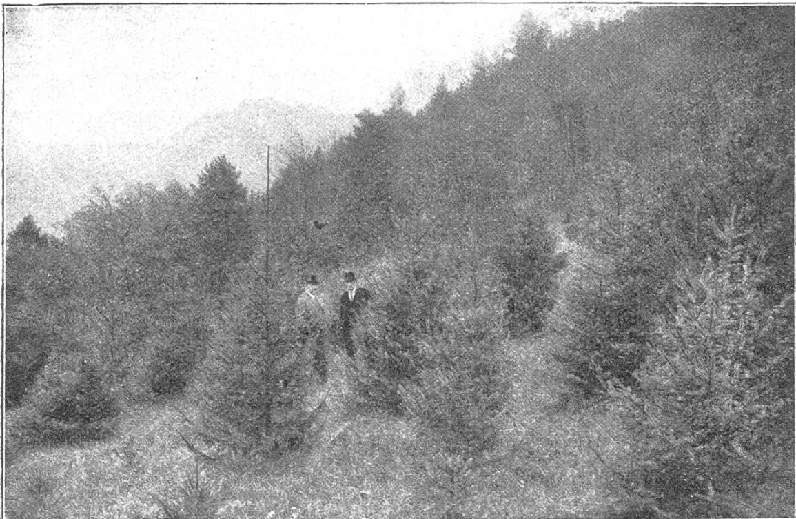
Abb. 5. Picea Omorica Pančić in Marschlins.

der zur Erziehung dieser Holzart in Marschlins bezogene Samen direkt aus Bosnien. Dieser Baum kommt aber auch in der Herzegovina, in Serbien und Bulgarien vor. Er wird einige 40 m hoch und hat einen schlanken, säulenförmigen Habitus mit silberglänzender Benadelung. Dieser Glanz rührt daher, daß die weißen Spaltöffnungsreihen nicht, wie bei unserer einheimischen Tannenart an der untern, sondern an der obern Seite der Nadeln sich befinden.