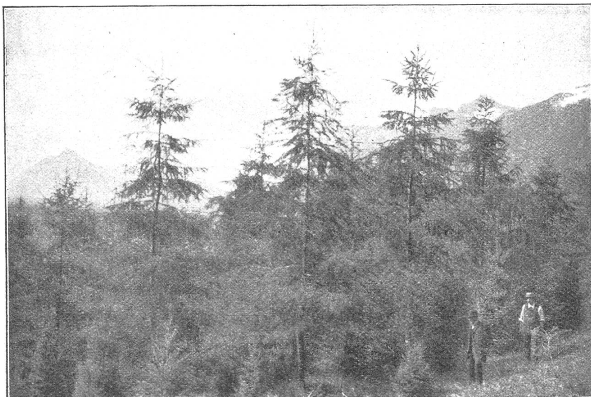
Abb. 4. Larix Marschlinsi in Marschlins, mit gleichzeitig eingepflanzten Pseudotsuga Douglasii Carr.

In dieser Mitteilung liegt die Beantwortung der gestellten Frage. Es darf mit ziemlicher Bestimmtheit angenommen werden, daß die Bestäubung der weiblichen Blüten der japanischen Lärche im Tscharnerholz durch die männlichen Blüten des erwähnten Horstes europäischer Lärchen stattgefunden habe; es fand eine Kreuzung dieser beiden Lärchenarten statt. Nicht nur die Farbe der weiblichen Blüten der europäischen Lärche spricht dafür, sondern auch die oben beschriebene