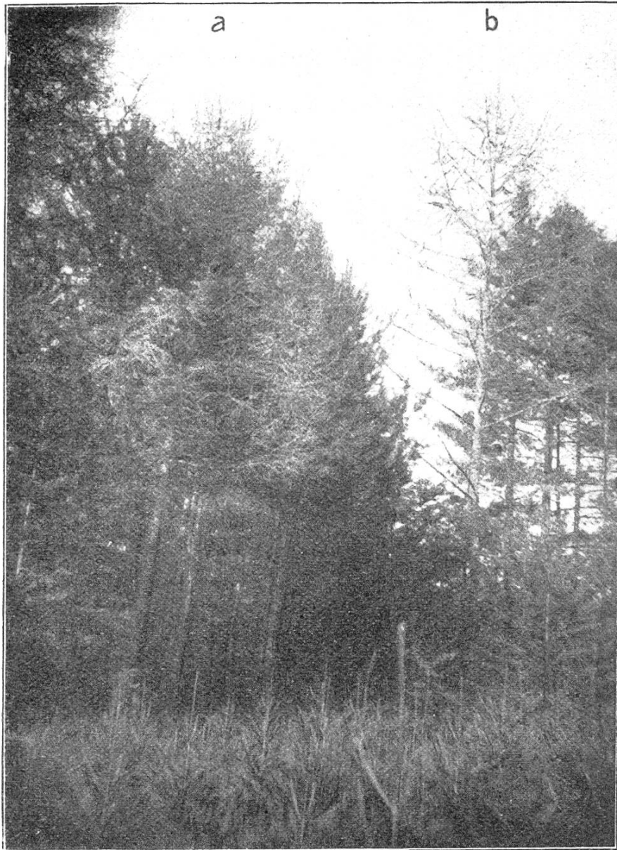
Abb. 3. Alter Pflanzengarten Tscharnerholz in Murten.

Die gefällige Antwort lautete dahin, daß etwa 50 m vom Tscharnerholz entfernt annähernd 35 jährige europäische Lärchen stehen, die