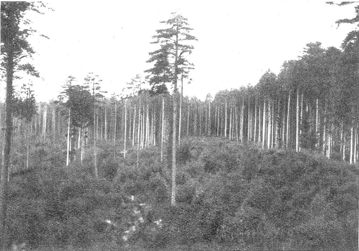
Phot. S. Amichel, 1922

Zunächst möchte man vielleicht vermuten, das skizzierte Verfahren müßte erhöhte Sturmgefahr zur Folge haben. Das ist jedoch, soweit man uns versicherte und wir auch einigermaßen wahrnehmen konnten, nicht der Fall. Bei der Weißtanne als Hauptholzart ist das