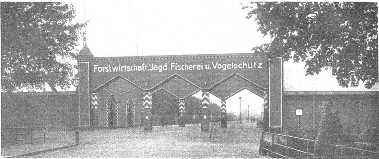
Haupteingang zur Winterthurer Ausstellung

material (4. Revision 1924). Wer das Buch nicht nur von außen bewunderte, sondern zu durchblättern wagte, stieß auf eine Fülle anregender Beobachtungen. Was die ebenfalls ausgestellten Studien desselben Autors über die Holzartenverbreitung im Kanton Zürich anbetrifft, so ist zu hoffen, daß unsere Zeitschrift über diese sehr willkommenen Arbeiten, insbesondere was die Eiche und die Föhre betrifft, ausführlich berichten wird.