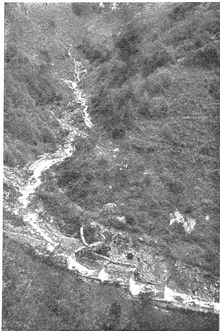
Abb. 3. Verbauungen im Cujellobach Aufnahme 1924

Schon kurze Zeit nach Ankauf und Aufhebung der Weiden machte sich eine auffallende Besserung der Abflußverhältnisse bemerkbar. Der Regender, früher an den gründlich abgeweideten Hängen rasch oberflächlich abfloß, bildete in kürzester Zeit Wildbäche von stromartigem Verlauf; die nun geschonte Grasnarbe nimmt beträchtliche Quantitäten Wasser auf, sie stellt ein, wenn auch nur unvollkommenes Reservoir dar. Von Jahr zu Jahr nun werden sich die Verhältnisse mit zunehmender Uberschirmung des Bodens durch den heranwachsenden Wald weiter bessern. Wertvolle Aufschlüsse hierüber liefert die Wassermeßstation an der Grenze des Einzugsgebietes, in der von einem besondern Aufseher das täglich abfließende Quellwasser, sowie dessen Temperatur festgestellt wird und die zugleich für die meteorologische Zentralanstalt in Zürich die Niederschläge ermittelt. Nach den seit 1897 vorliegenden Beobachtungen ist der mittlere Quellertrag 4200 Minutenliter. Den geringsten Zufluß von 1080 Litern lieferte bis heute der Monat Februar des Jahres 1922. Mit ihm nahm eine sechsmonatige Trockenperiode ihr Ende. Die jährliche mittlere Niederschlagsmenge beträgt 1057 mm.