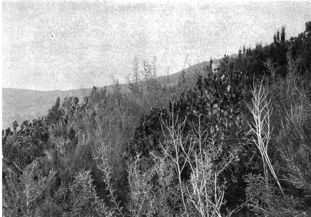
Abb. 2. Sechsjähriger Macchienbrand beim Col de Serra nach Rogliano (Korsika), 230 m ü. M., zwischen den abgebrannten Sträuchern hauptsächlich Stockausschläge von Arbutus und Erica arborea