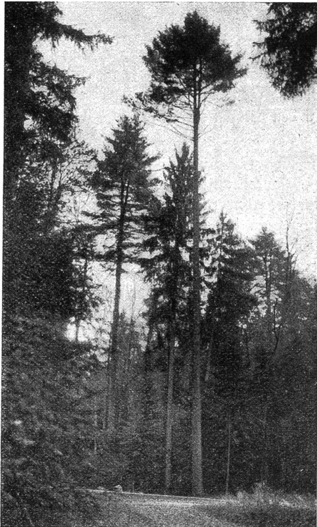
Abb. 2. Cirka 90jährige Weymouthsföhren im Breunigartenwald der Burgergemeinde Bern Durchmesser in Brusthöhe des Stammes im Vordergrund 72 cm, Baumhöhe 38 m. Aufnahme 1928

Besonders wertvoll sind die Angaben von Herrn Stadtoberförster S c h w a r z über das Vorkommen der Weymouthsföhre in fünf Revieren der Stadtwaldungen von Zofingen. Es sind dort nach der letzten Wirtschaftsplanrevision vorhanden :