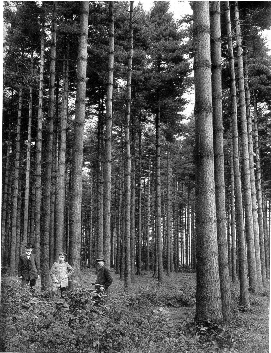
Tafel I. Die ehemalige Weymouthsföhren-Versuchsfläche im st. gallischen Staatswald Goldach

Angaben pro ha, 1908: Stammzahl 546, Gesamtmasse 905 m 3 , Alter 54 Jahre 1916: „ 152, „ 384 m 3 , „ 62 „