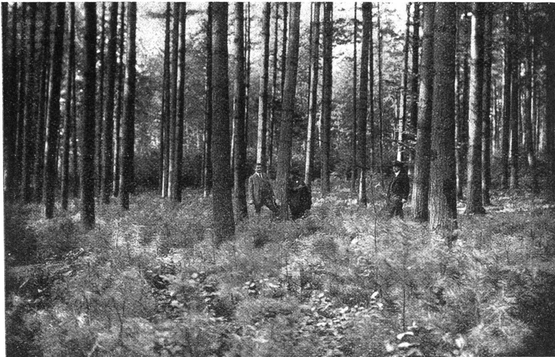
Abb. 1. Lenzburger Stadtwald Lütisbuch

Man begann erst, mit dem Anbau zurückzuhalten, als der Blasenrost ( Peridermium strobi Kleb.), der zuerst um das Jahr 1890 bemerkt wurde, sich immer stärker verbreitete und viele jüngere Bestände arg dezimierte. Die Krankheit hat ihre Gefährlichkeit bis heute nicht verloren, so daß zahlreiche Forstleute des In- und Auslandes zu der Ansicht neigen,