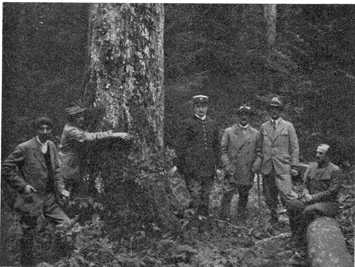
Ein Besuch im Gemeindewald Efferval-Tartre vom Jahre 1928.