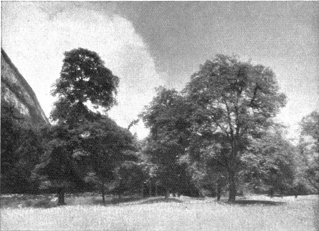
Nußbaumhain bei Frümjen im St. Galler Rheintal.

venienz, sondern einzig und allein unsere landläufigen Nußbäume, unsere „Landnuß“, scheint nach unsern bisherigen Erfahrungen und Beobachtungen das einzig richtige zu sein im Walde. Speziell in den Laubholzbeständen bis etwa 900 m Meereshöhe in den verschiedenen Kalkgebieten, in den Föhntälern am Alpenfuß, am Jurafuß ist der Nußbaum zum Teil heute schon eine sehr wertvolle, aber leider vielfach noch vernachlässigte Mischholzart, die bei geeigneter Pflege fähig ist, mit verhältnismäßig wenig Holzmasse große Gelderträge hereinzubringen. Schon