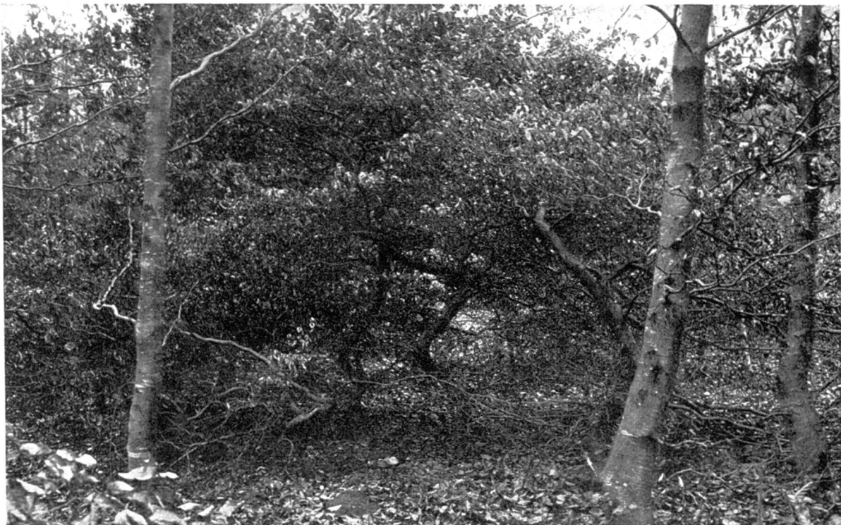
Bild 3. Achtjährige Nachkommen: links von einer Hängebuche aus Dänemark, rechts von schönen Buchen vom Degenried bei Zürich.