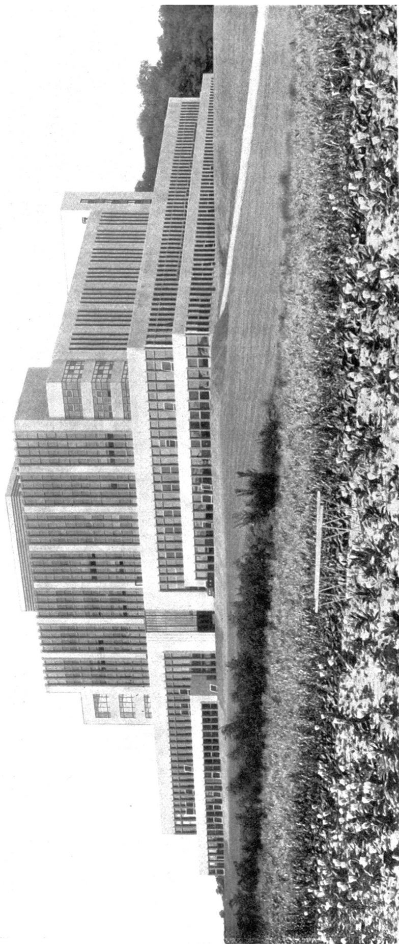
Holzforschungsinstitut Madison (Wisconsin, U. S. A.).