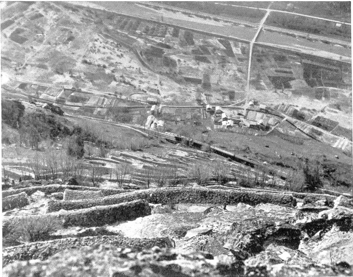
Der terrassierte Hang (schräg abwärts aufgenommen).