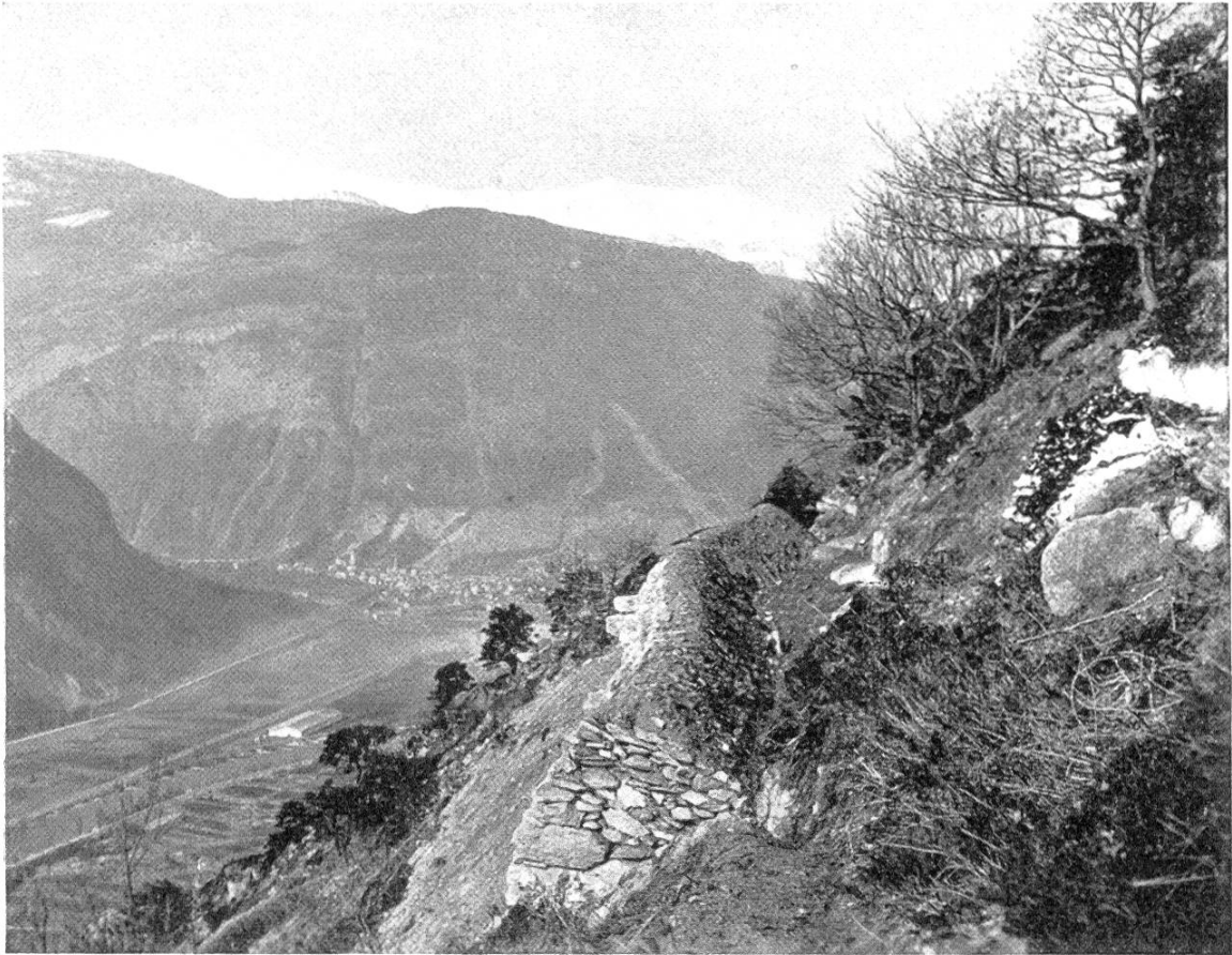
Ueberreste des ehemaligen Waldes. Kleine Depotmauern und Terrassen.