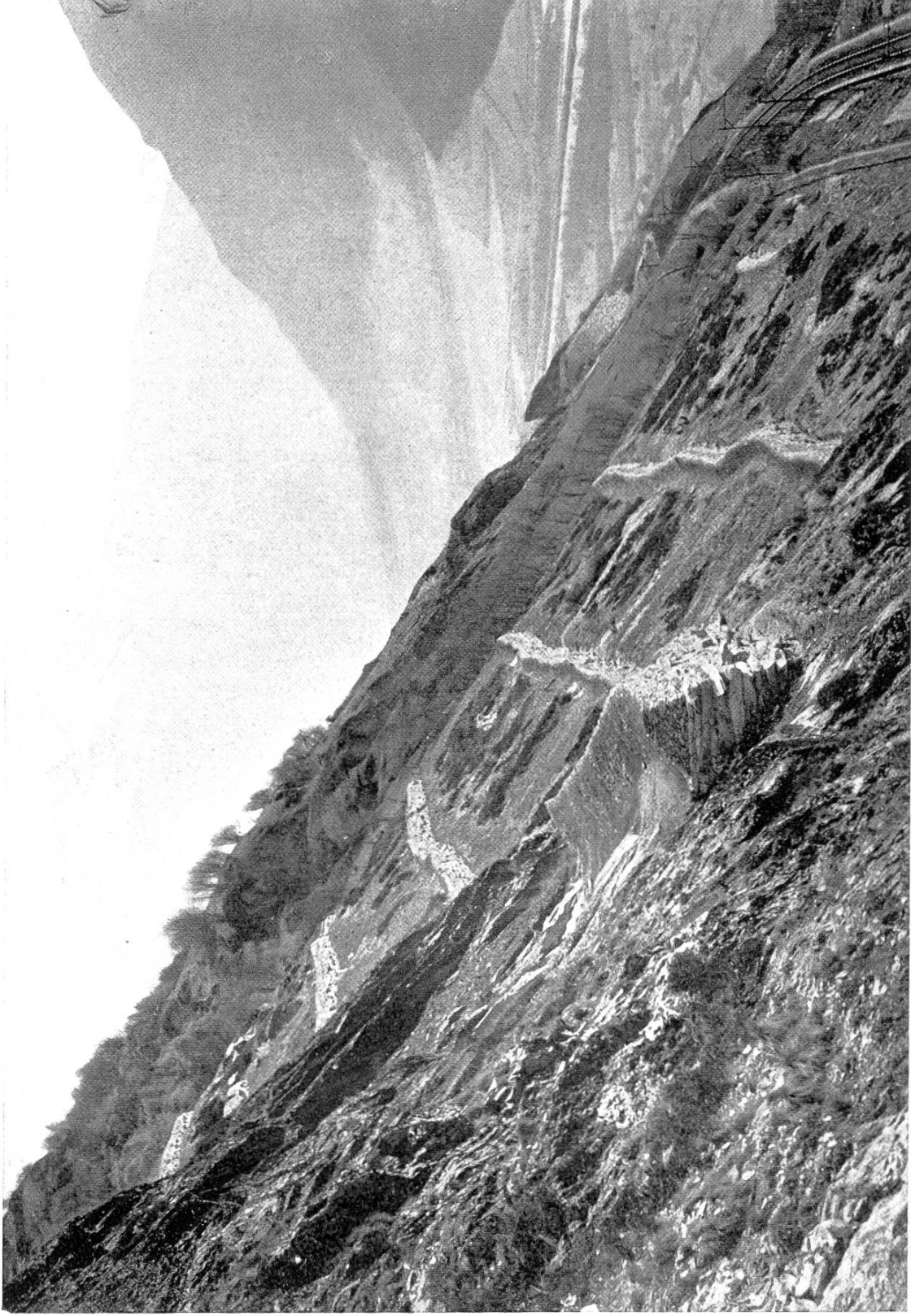
Regelmässig terrassierter Hang an der Lötschbergbahn. Jeder fallende oder rollende Stein wird abgebremst und von einer Mauer aufgehalten.