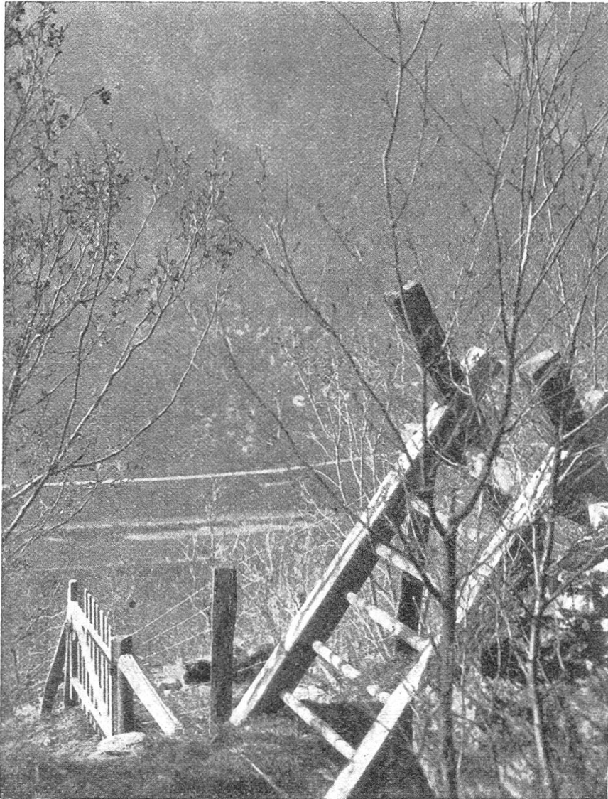
Einfriedigung, Gatter und Leiterübergang.

zwar durchwegs mit gutem Erfolge. Schon nach zwei Jahren hatte sich fast überall eine dichte Grasdecke entwickelt. Sie leistet vorzügliche Dienste, indem sie die Wasserverdunstung verlangsamt und das Wegtragen des Bodens durch den Wind verhindert. Das Gras wird nicht gemäht, sondern verdorrt und verfault, wird also mit der Zeit das Seine zur Bodenverbesserung beitragen. Im Spätsommer