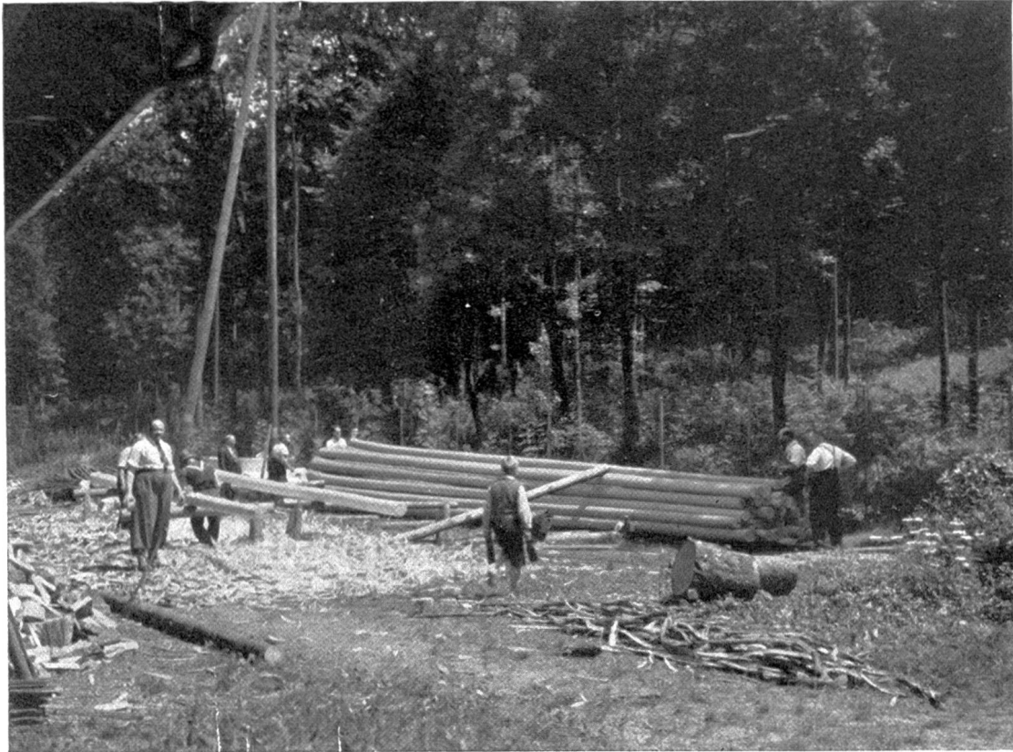
Abb. 1. Der Aufbau eines Mastenstapels für die Osmotierung. Die Maste werden auf den Böcken im Vordergrund geschält, mit der Imprägnierpaste bestrichen und hernach auf den Stapel gerollt.