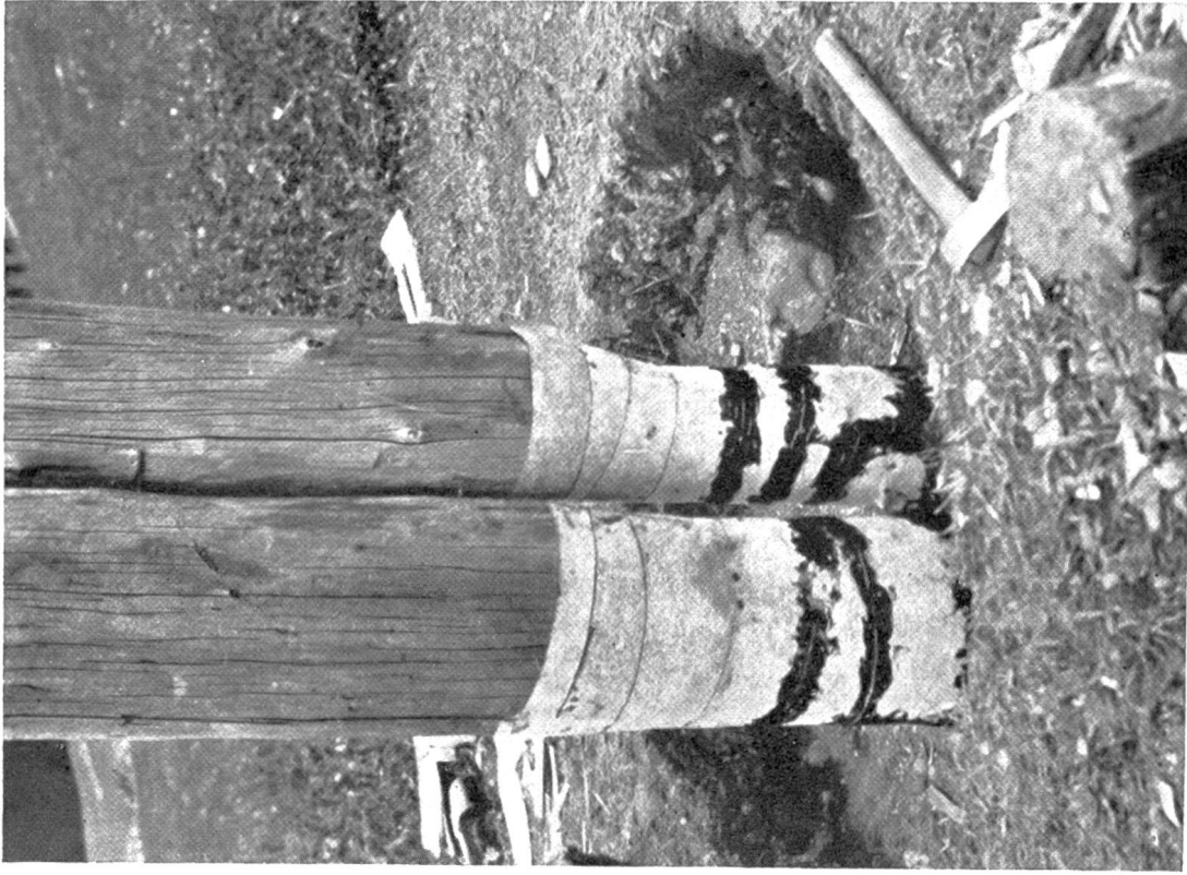
Abb. 2. Bandagierung verbauter Maste.