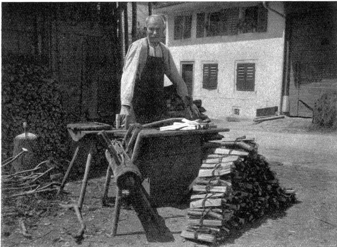
Phot. Brodbeck, Juni 1934.

Wer im Sommer vom solothurnischen Bezirksorte Dornach aus durch das romantische Pelzmühletal auf das Gempenplateau wandert, wird am Ausgange des Dörfchens Gempen, an der Strasse gegen Hochwald, einige primitiv gebaute offene Hüttchen finden, darin, inmitten einiger Reisighaufen, einen Mann, der mit grosser Geschicklichkeit winzige Wellen anfertigt.