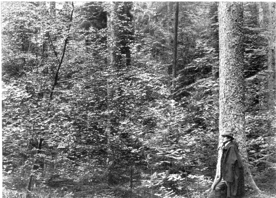
Aufnahme im Herbst 1934.