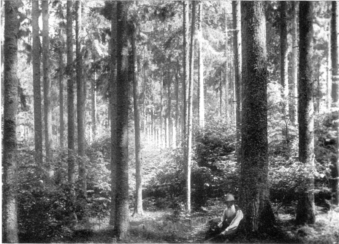
Aufnahme Juni 1924.