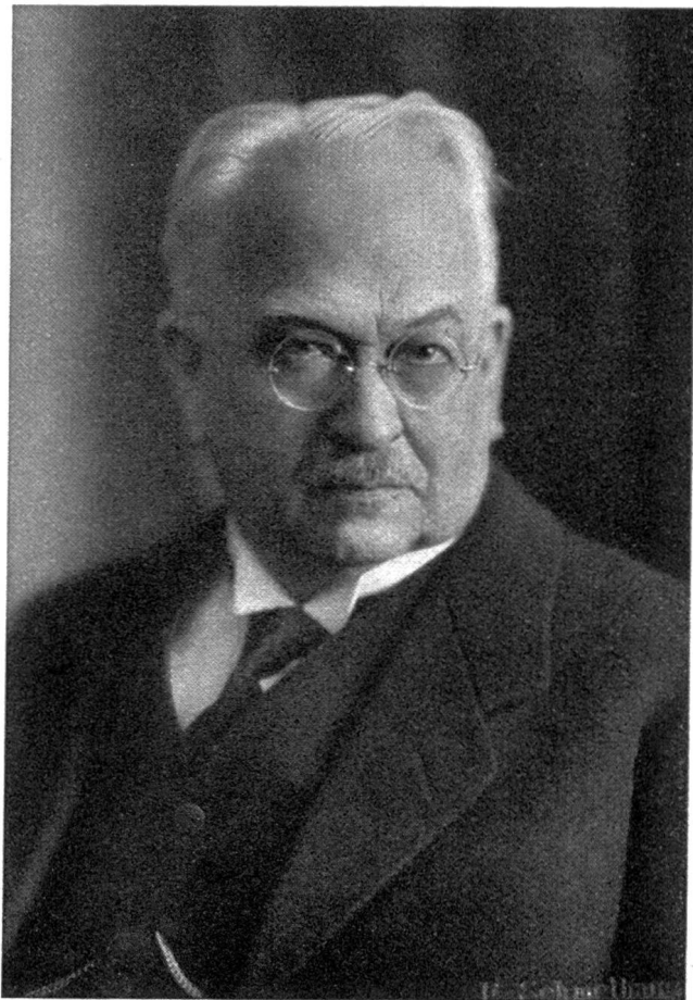
Professor Caspar Zwicky.