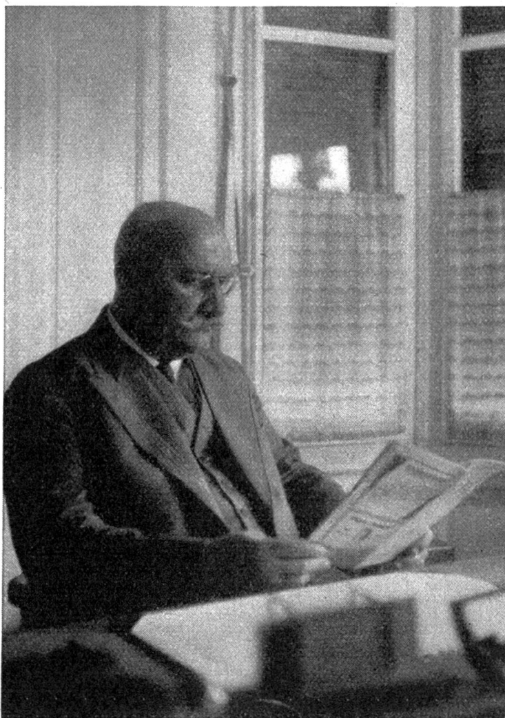
Henri Golay. 1871—1936.