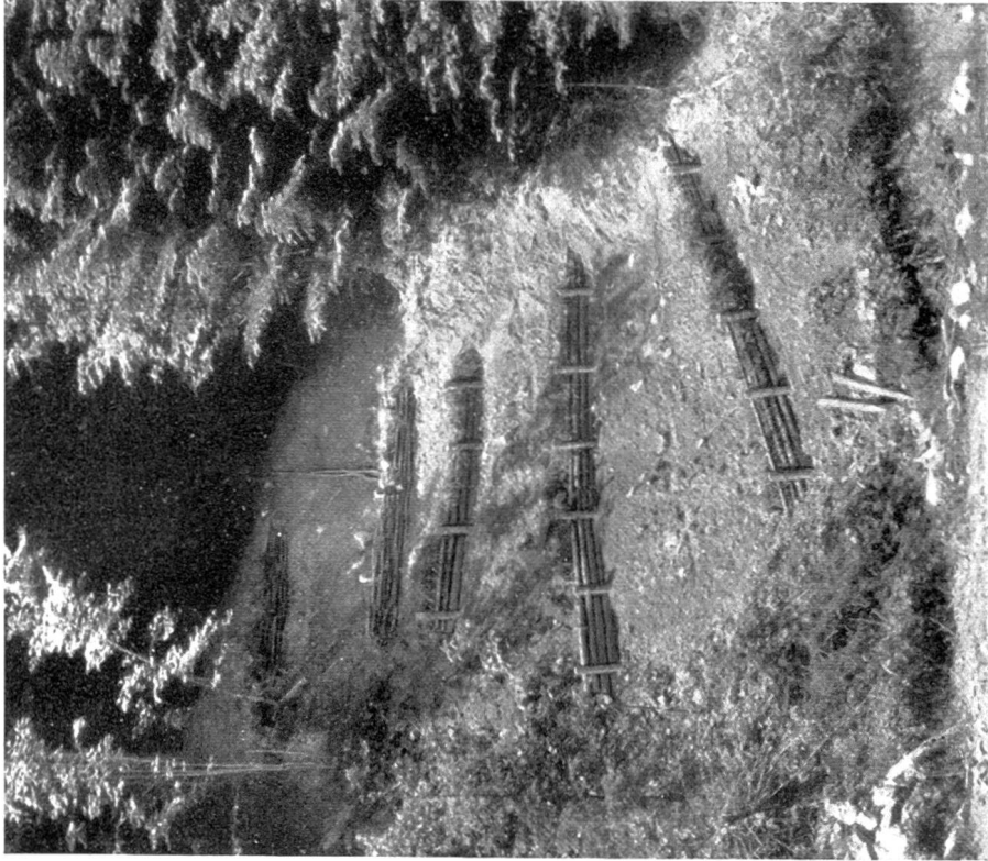
Bild 2. Kleiner Rutsch, oben abgeoscht, verbaut, noch unbesat und unbepflanzt. (Unten Stangenhage, oben Flechtwerk )