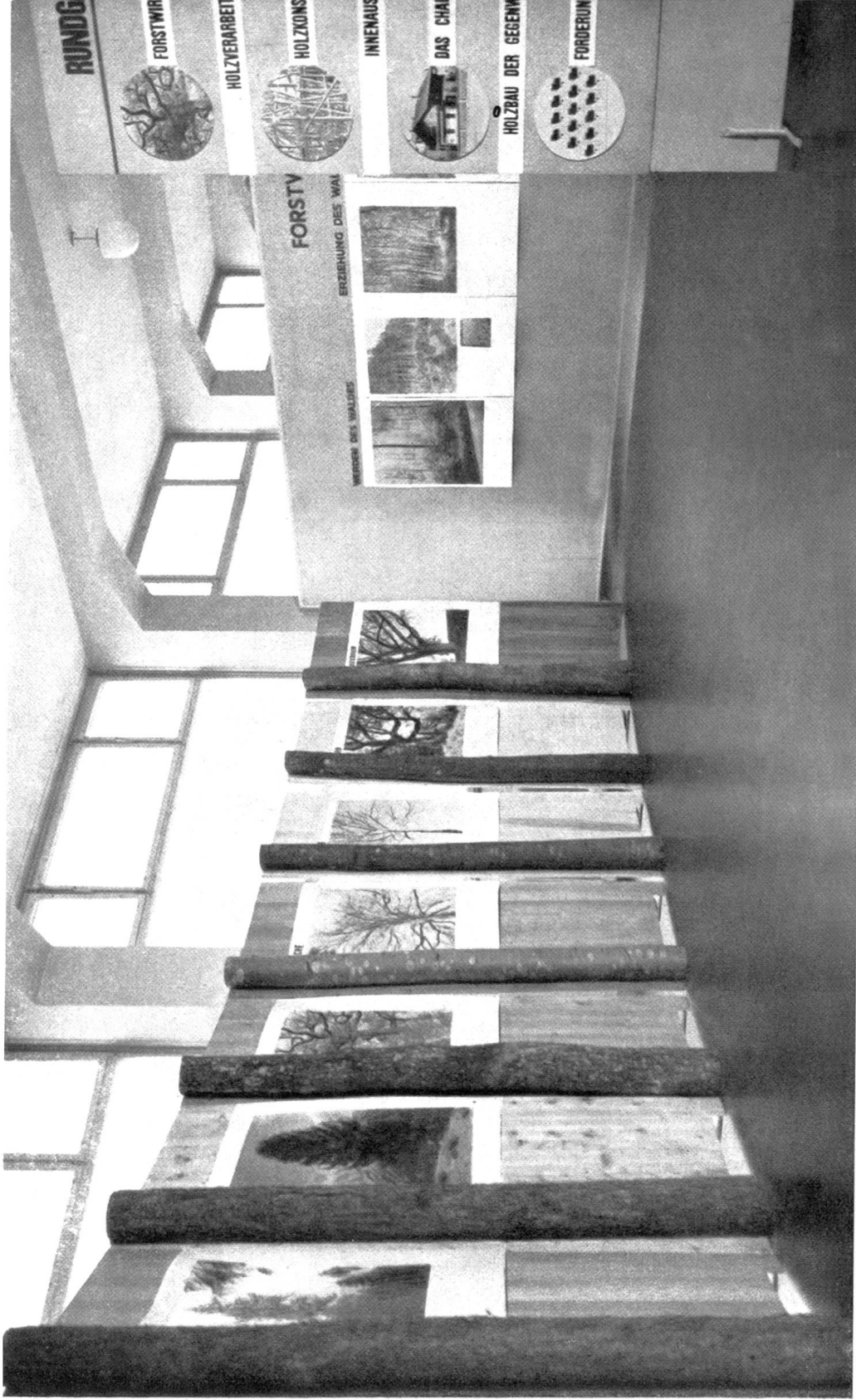
Abb. 1. Aus der Abteilung Forstwirtschaft der Ausstellung „Das Haus aus unserm Holz“ im Gewerbemuseum der Stadt Zürich.