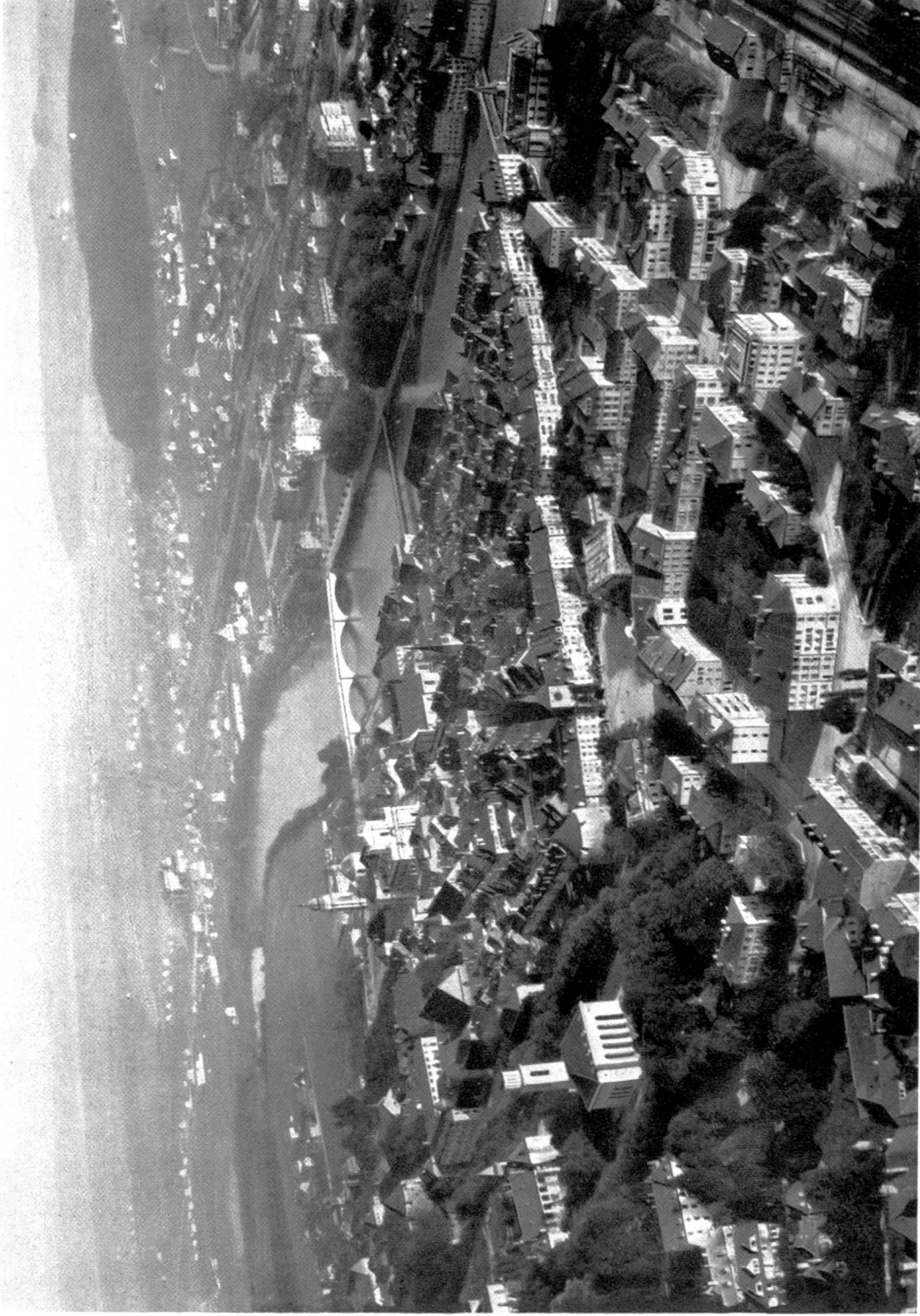
Die Stadt Solothurn.