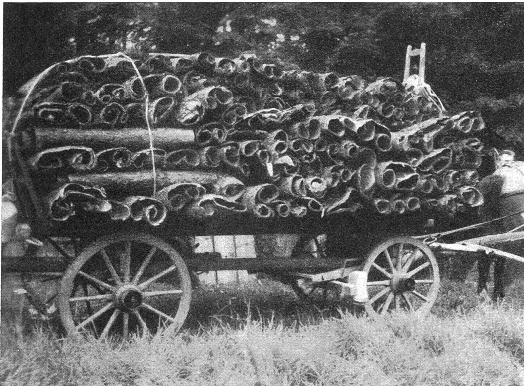
Bild 3. Lagerung und Trocknung der Rinden in Wasen i. E.