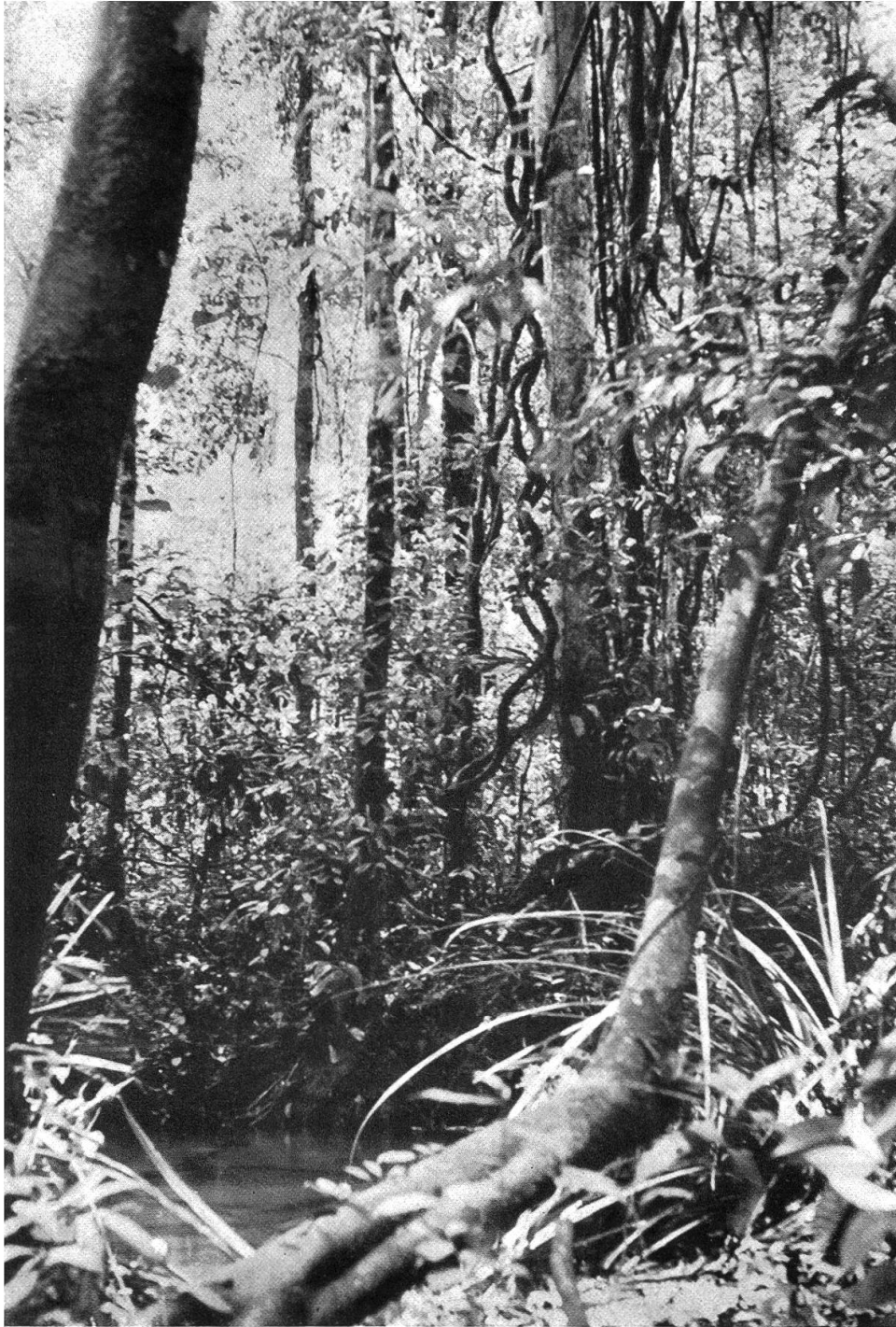
Bild 2. Urwald an der Ostküste von Sumatra. Lianen.