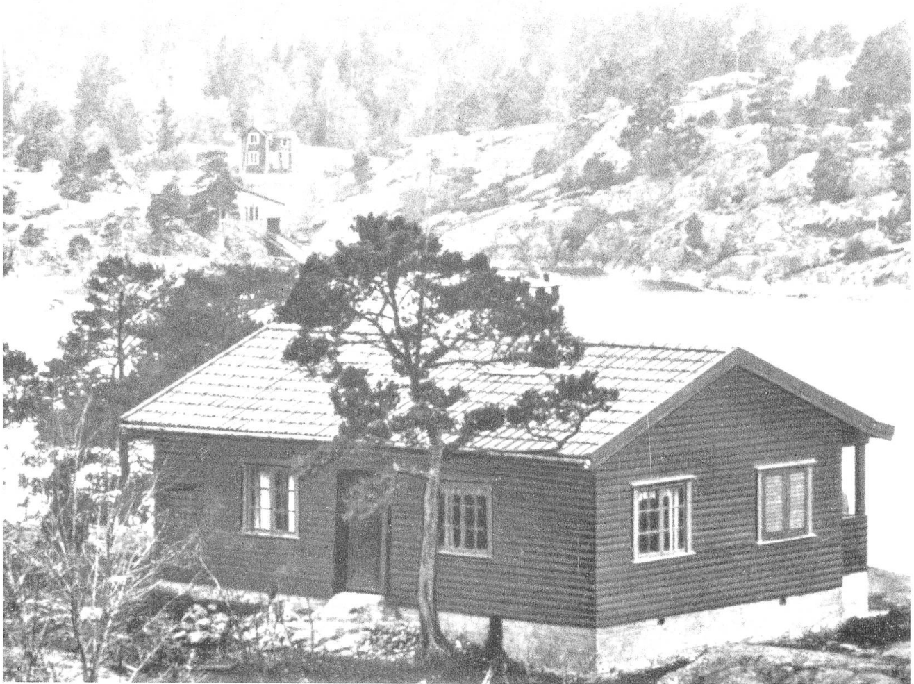
Bild 1. Wochenendhaus bei Stockholm.