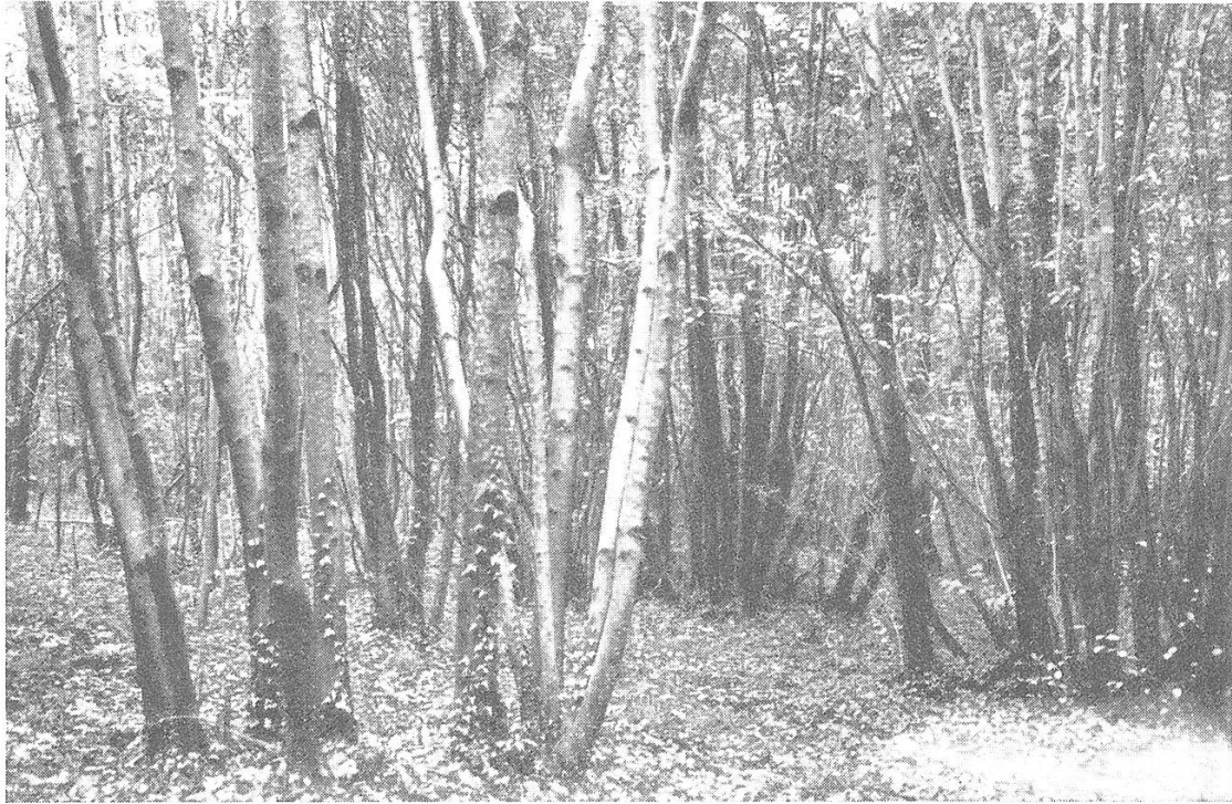
Ausschläge von Ahorn, Ulme, Esche und Haselstauden in Abt. 11.