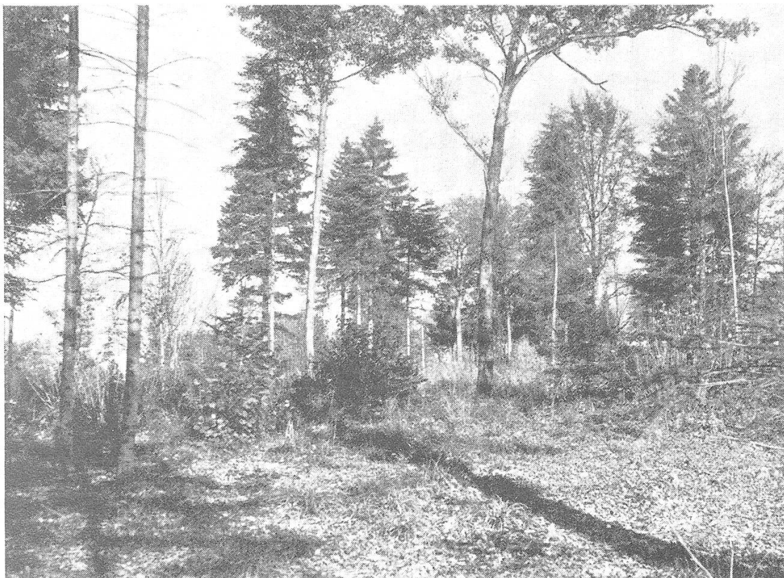
Letzter Mittelwaldschlag (1926/27) in Abt. 10, Liebenseckhau.