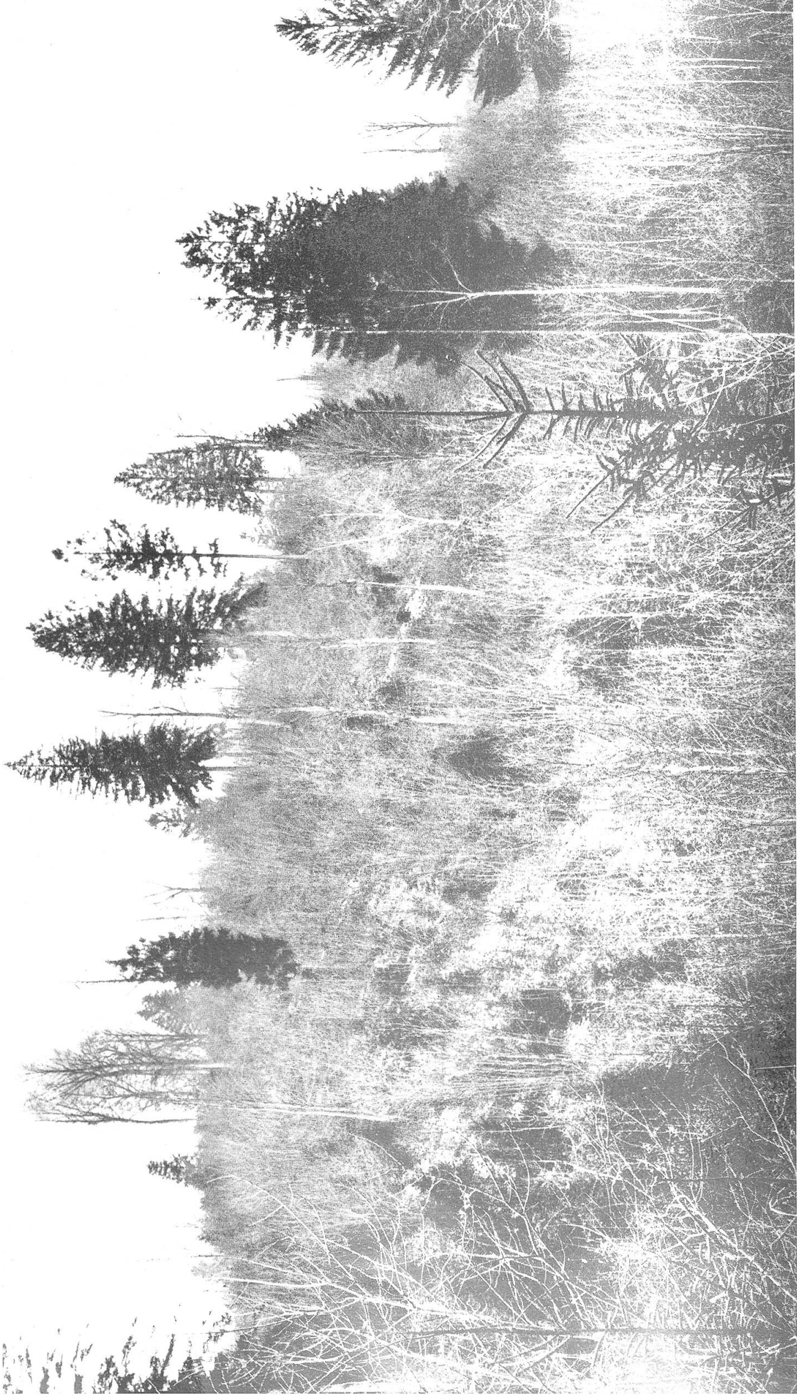
Zustand der letzten Mittelwaldschläge (Winter 1926/27) im Frühjahr 1933.