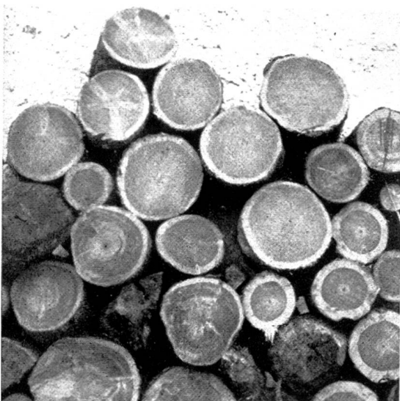
Bild 3. Rote Föhren aus der Gegend von Cordona, gut entwickeltes Kernholz.