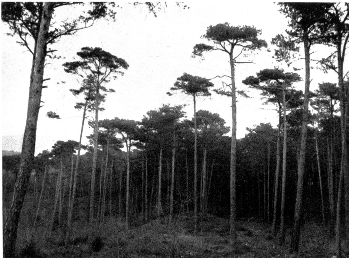
Bild 11. Pfinwald, graue Föhren.