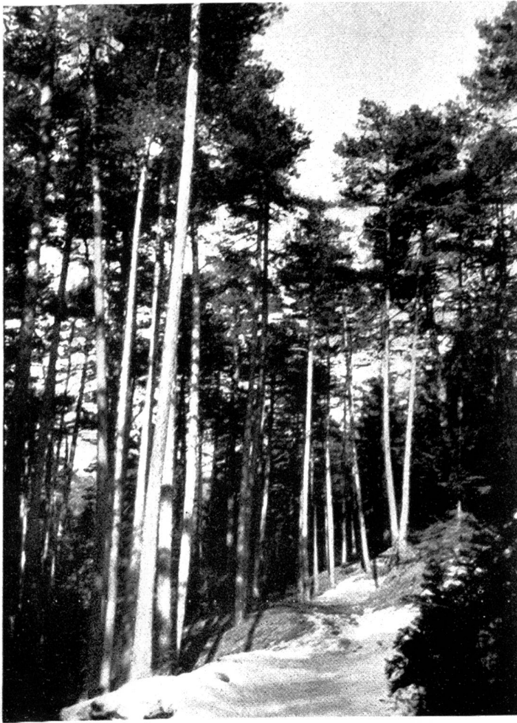
Bild 7. Icogne, Abt. 7, schöner Rotföhren- bestand.