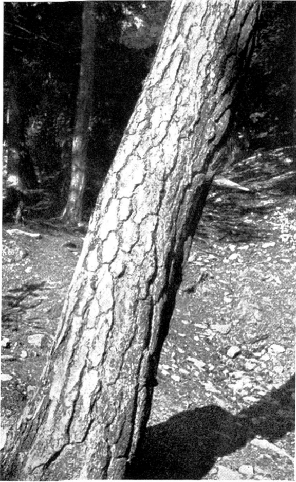
Bild 1. Rote Föhre von Cordona, über Miège.