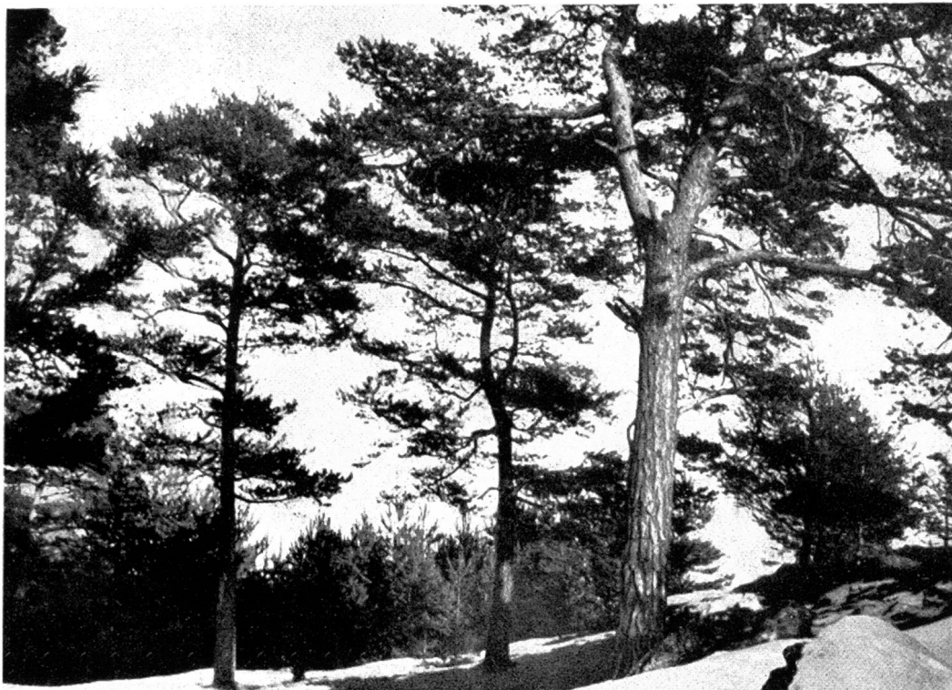
Bild 8. Icogne, Abt. 1, graue Föhren.