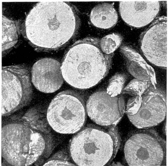
Bild 4. Graue Föhren aus dem Pfinwald, 60–80- jährig, mit schlecht ausgebildetem Kern.