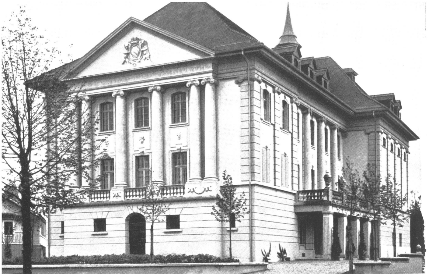
Theater (erbaut 1914—1916).