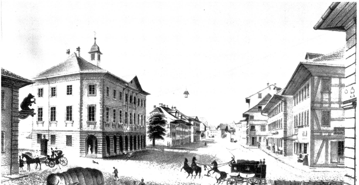
Langenthal vor 100 Jahren (« Bären », Kaufhaus, Marktgasse).