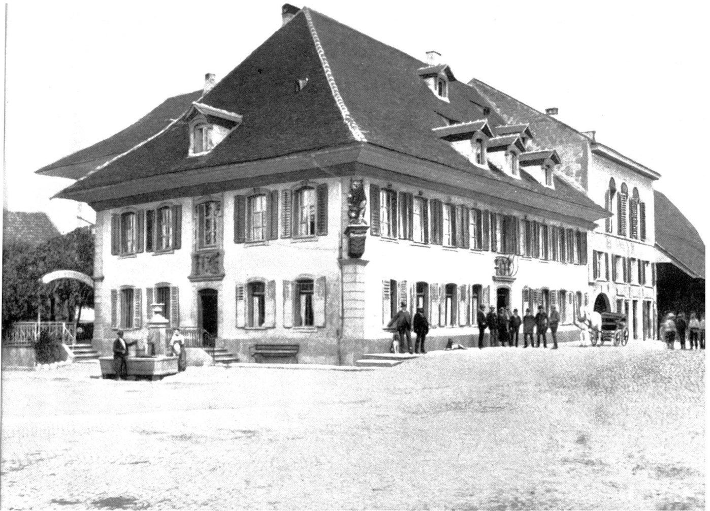
Gasthof zum « Bären » 1888.