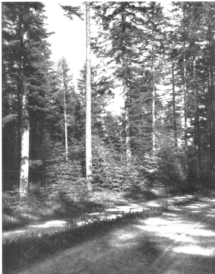
Bild 1. Ortsgemeinde Oberriet, Abt. 8. Altholz mit Naturverjüngung Fi, Ta, Bu.