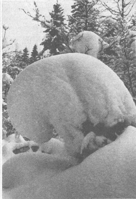
Vom Schnee gebogene Fichte am Chemin de la Réserve

fälligste Merkmal der Risoud-Fichten läßt vermuten, daß hier der Schnee bei der Selektion eine ausschlaggebende Rolle spielt. Zur Verjüngung sind seit jeher nur diejenigen Bäume gelangt, die zufolge der Biogsamkeit ihrer Äste und der dadurch bedingten Schlankheit der Krone dem Schneebruch widerstehen konnten. Auch unter jungen Fichten ist die bruchresistente Rasse des Vallée de Joux sofort kenntlich. Die Bäumchen sind von einer auffallend elastischen Biogsamkeit, die sonst nur gewissen Weidenarten eigen ist (Abb. r.).