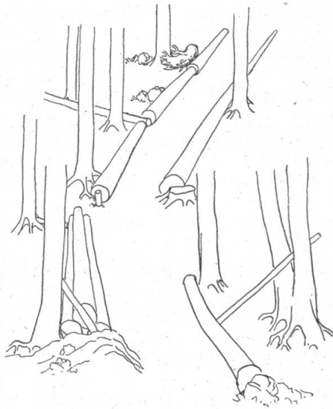
Abbildung 4 Verlegen einer Treibgasse

gehend jeweils das oberste Bloch in Schwung bringt, auf daß es krachend zwischen den Bäumen zu Tal fährt. Vielmehr wird das Holz trichterförmig durch Verleger zusammengebracht und gemeinsam in Gräben, Rinnen oder notfalls in eigens geschlagenen, seitlich verlegten Treibgassen hinabgeschleust.