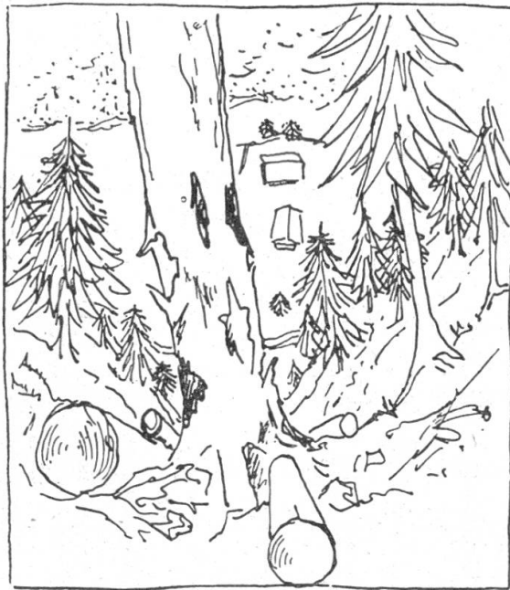
Abbildung 1 «Muß das sein?»

Zugegeben: Das Treiben des Holzes ist für einen ausgebildeten Techniker, der die Probleme mit dem Rechenschieber anzugehen gewohnt ist, ein langweiliges Kapitel; er geht nur ungern daran, sich näher damit zu beschäftigen. Die Materie ist für einen Kopfarbeiter schon deshalb etwas schwierig, weil sie zum großen Teil nur mit praktischer Arbeitserfahrung zu beherrschen ist und nur im Wald, mit dem