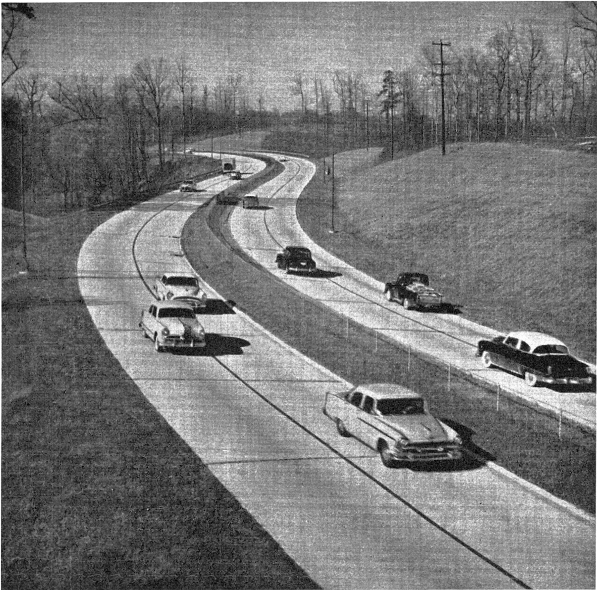
Autobahn bei Atlanta (Georgia, USA)

und Öffentlichkeit ist bekannt, welche Trassen nach Ansicht dieser Kommission auszubauen sind und welche technischen Normalien dabei beobachtet werden müssen.