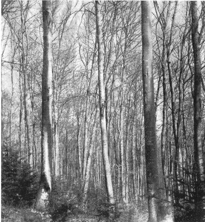
Typ. Buchenwald «Geissfluh», Obererlinsbach, etwa 900 m ü. M., Stockausschlagwald, mehrmals durchforstet. Lichtwuchsdurchforstung, stellenweise bereits Femelschlag, Ta-Naturverjüngung in Lücke, Nutzholzanfall gering.

reszuwachs von 4 m 3 pro ha an, der vorwiegend aus Brennholz besteht, so erreichen wir durch die Umwandlung eine Erhöhung auf mindestens 6 m 3 , somit eine Mehrproduktion von rund 8000 m 3 , das heisst eine Steigerung des gesamten Jahreszuwachses von rund 17 000 m 3 auf rund 25 000 m 3 . Dieser Holzanfall wird aber nicht mehr zum grössten Teil aus Brennholz bestehen, sondern das Nutzholz wird mit mindestens 50 % vertreten sein, darunter ein