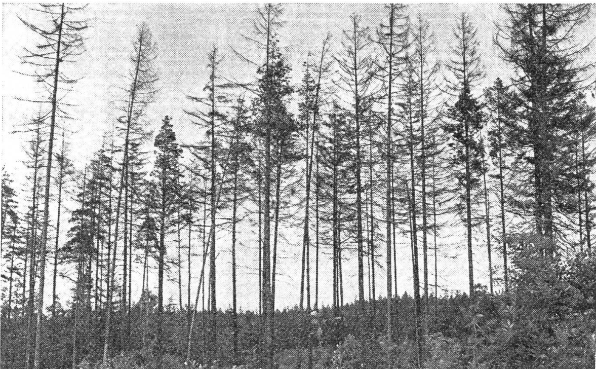
Abbildung 2. 60jähriger Fichtenbestand im Erzgebirge, absterbend, etwa 15 km von den Abgasquellen im böhmischen Braunkohlebecken bei Most entfernt. Immissionsbelastung nach Materna (1972): \bar{x} Jahr = 0,05 mg SO 2 .

Der Nadelwald ist im Empfindlichkeitsspektrum aller Lebewesen gegen SO 2 -Immissionen extrem empfindlich. Dies hat folgende sehr plausible Gründe, die ich beim letzten Hearing der deutschen Bundesregierung zur