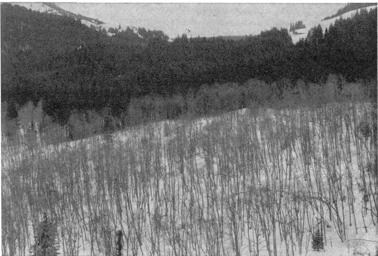
Bild 2. Ausgedehnter, gut 40jähriger Weisslerenbestand in der Aufforstung Tröli. Im Hintergrund gleichaltrige Fichtenbestände.

Die Weisslerenbestände umfassen mit 34 ha beinahe die halbe Wald- und gut zwei Drittel der Aufforstungsfläche. Sie sind fast ausschliesslich aus Kul-