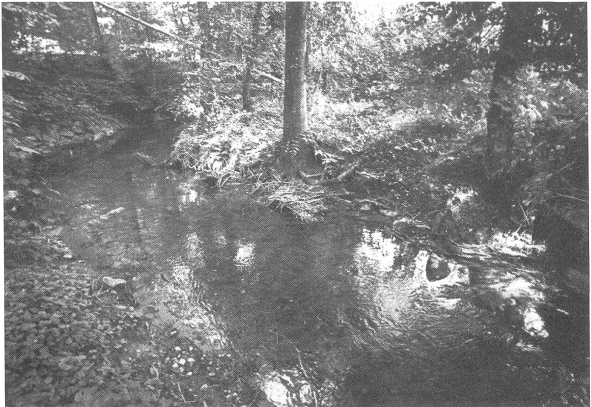
Abbildung 1. Waldbach, bei dem Fischunterstände durch das Wurzelwerk der Bäume im Bachlauf gebildet werden.