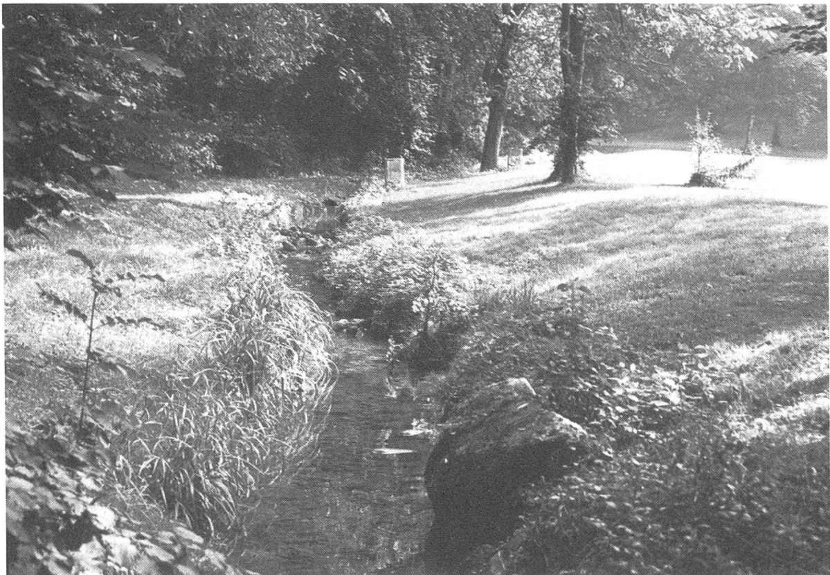
Abbildung 2. Wiesenbach, bei dem durch die Uferpflanzen Unterstände gebildet werden, die jedoch im Vergleich zu jenen der Waldbäche bedeutend kleiner sind.