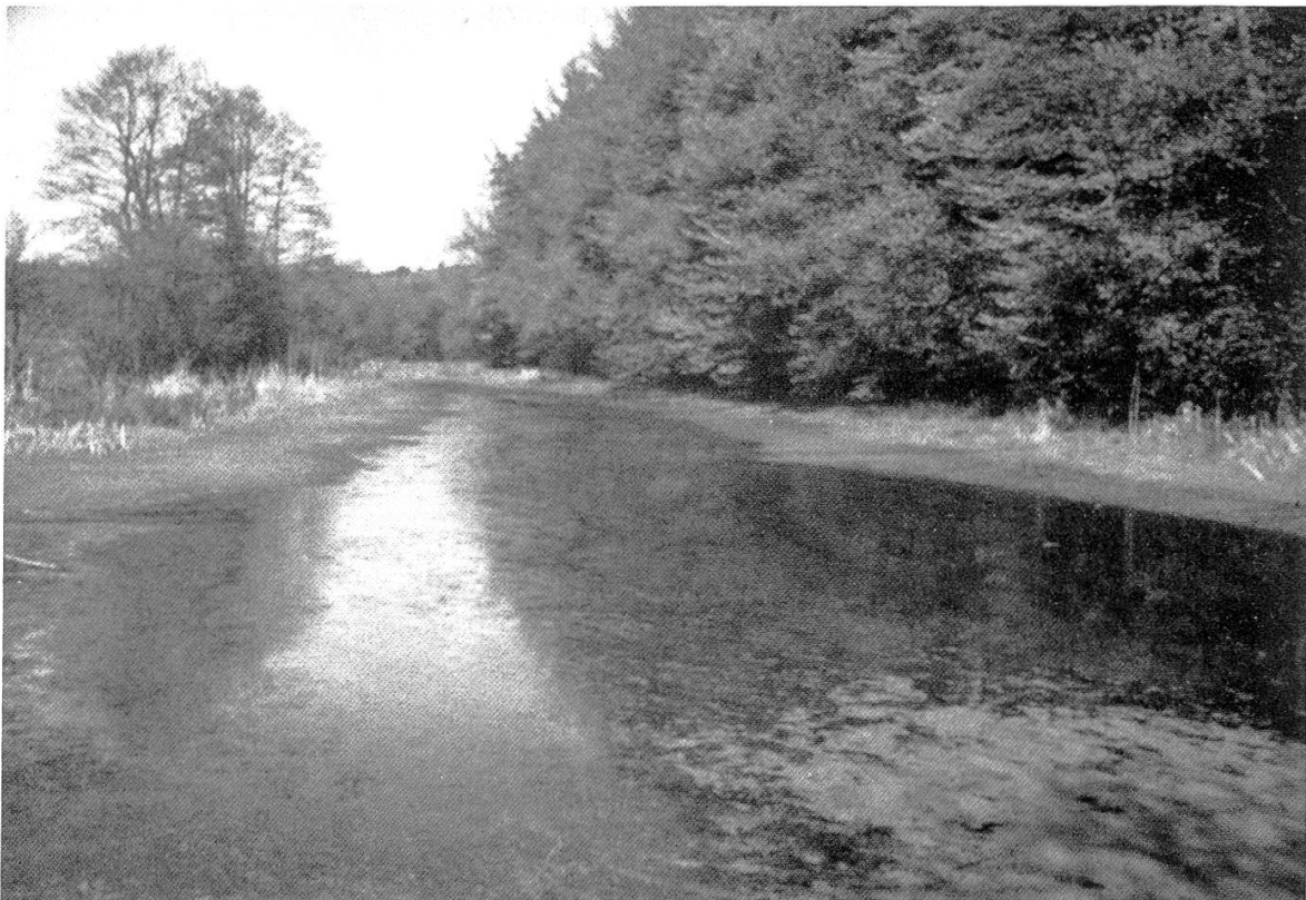
Excursion G. Etangs de Bonfol.