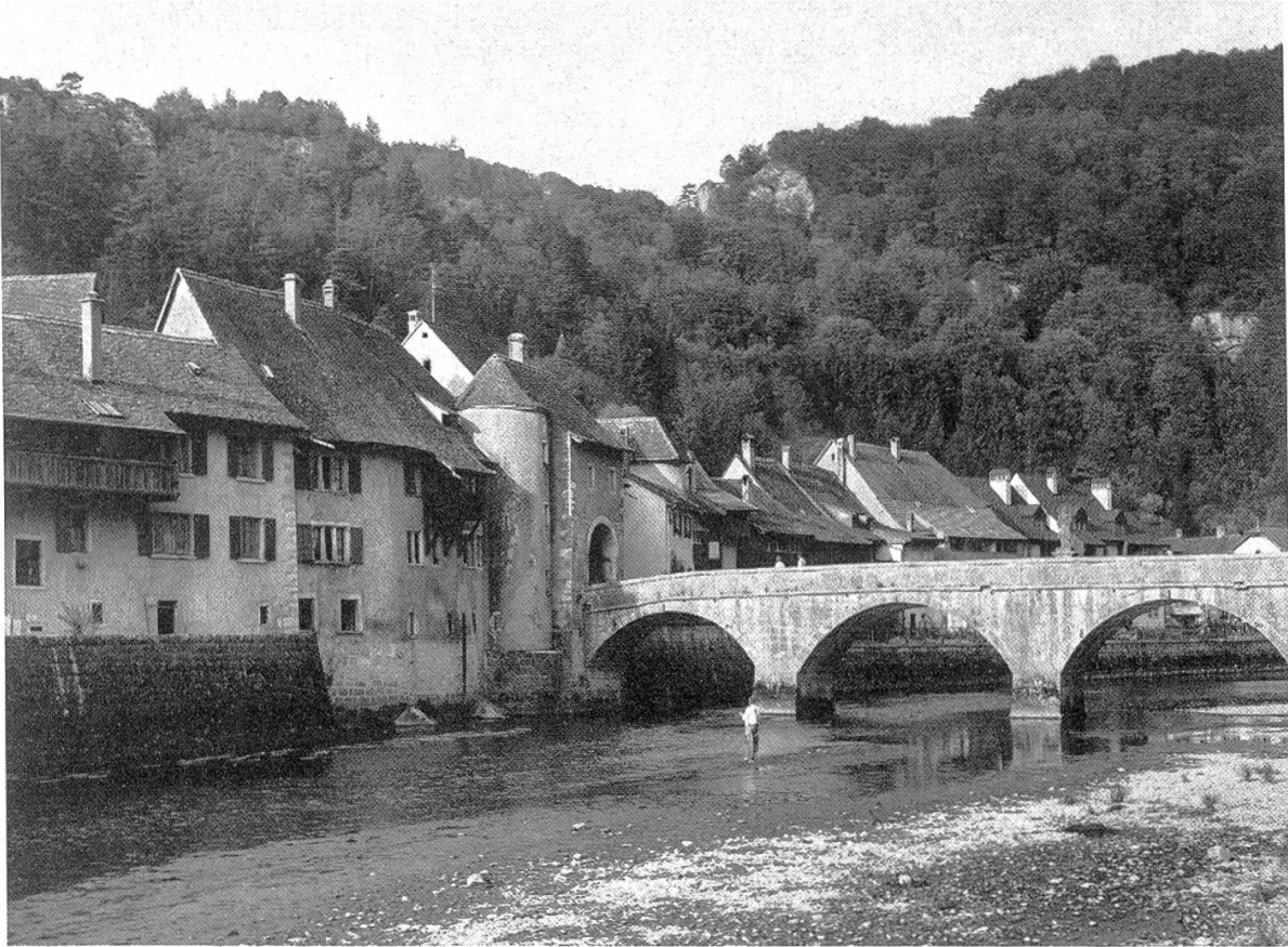
Excursion E. St. Ursanne.