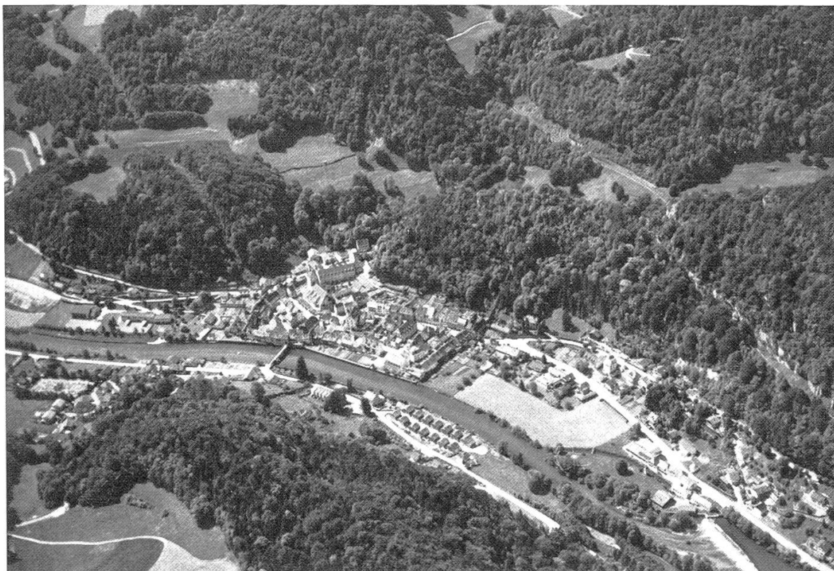
Figure 2. St-Ursanne entourée d'une partie de ses forêts.

dite simplifiée. Deux séries sont différenciées: la section de la futaie et la section du taillis. L'appréciation du sol, du climat et des peuplements existants occupe une part importante de ce travail. L'état général des forêts y est décrit; la méthode de détermination du matériel sur pied également. La révolution est fixée à 125 ans en moyenne pour toutes les essences. La quotité est calculée pour chaque série. Un dernier chapitre est consacré à l'organisation générale des exploitations de la prochaine période.