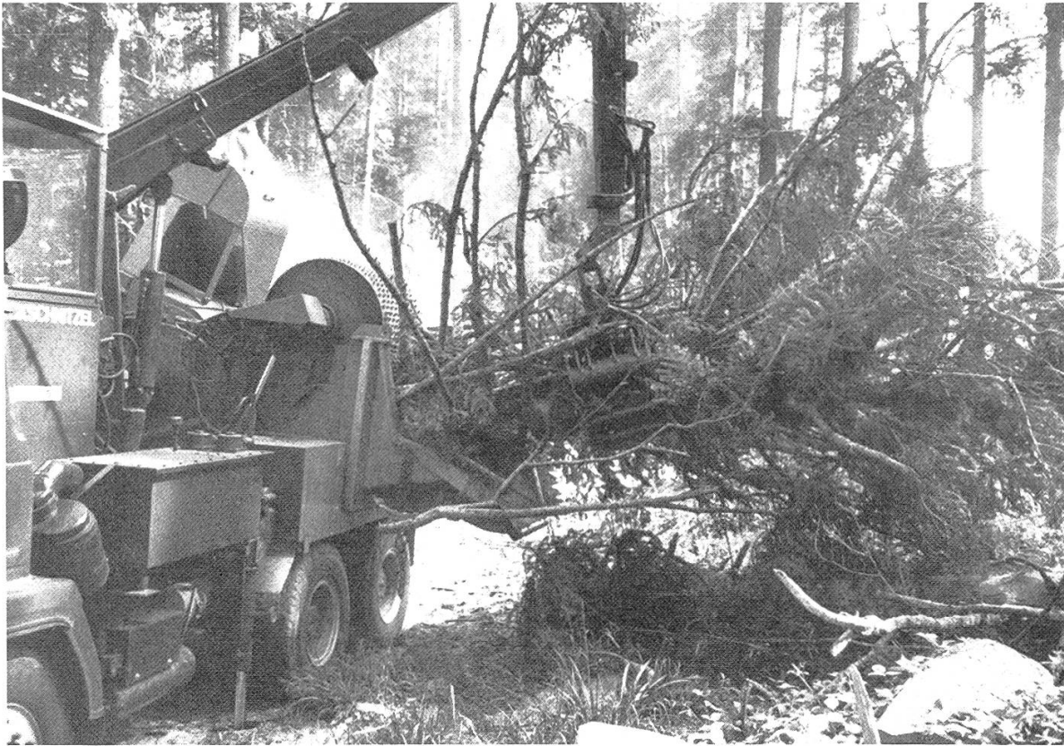
Figure 1. Déchiquetage d'une cime entière: Possibilité extraordinaire de rationalisation.