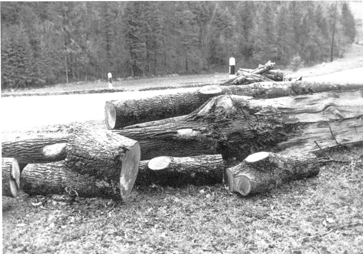
Figure 2. Bois à déchiqueter: rebuts.