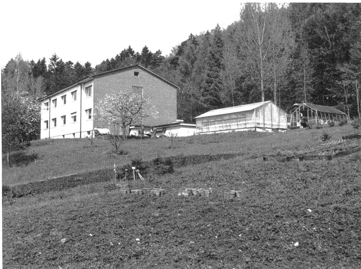
Figure 1. L'institut de lutte biologique à Delémont.

2. Expertises. Evaluation et planification de programmes de lutte biologique ou intégrée par une équipe d'expert-conseils.