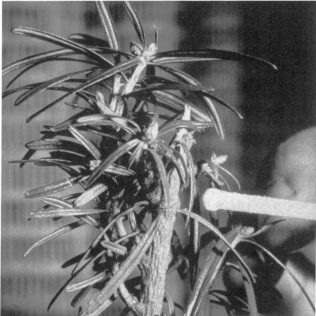
Abbildung 3. Durch Schalenwild mehrmals verbissener Weisstannen-Sämling.

Eliminierung der Tanne. Dieselben Entmischungsprozesse hat W. Schrempf (13) auch für den bekannten österreichischen Fichten-Tannen-Buchen-Urwald Rothwald nachgewiesen. Von grosser Bedeutung ist in diesem Zusammenhang auch der von B. M. Liss (9) erbrachte Nachweis, wonach die heute praktizierte Grossviehbeweidung die Tanne im Gegensatz zur oft gegenteiligen Annahme keineswegs selektiv benachteiligt. Tanne und Fichte wurden aufgrund dieser Untersuchungen zu weniger als 1 % verbissen, während Laubholz selektiv verbissen wurde, was aber nur beim Ahorn von Bedeutung war.