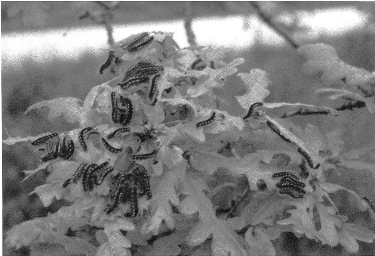
Figure 2. Au printemps 1988, les larves se sont réveillées dès les premiers jours d'avril et l'on observait alors facilement une centaine de chenilles prenant un bain de soleil sur chaque nid.

Sur les arbres dont la végétation débourre précocement, comme les fruitiers, les chenilles consomment les feuilles entièrement dès leur apparition. Elles descendent ensuite vers les branches basses.