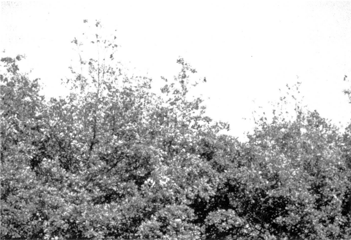
Figure 1. A l'automne 1987, à Jussy, les arbres envahis par le Cul brun ont vu l'extrémité de leur couronne complètement dépouillée.

Il peut également y avoir attaque de la cuticule des fruits (pommes et poires . . .).