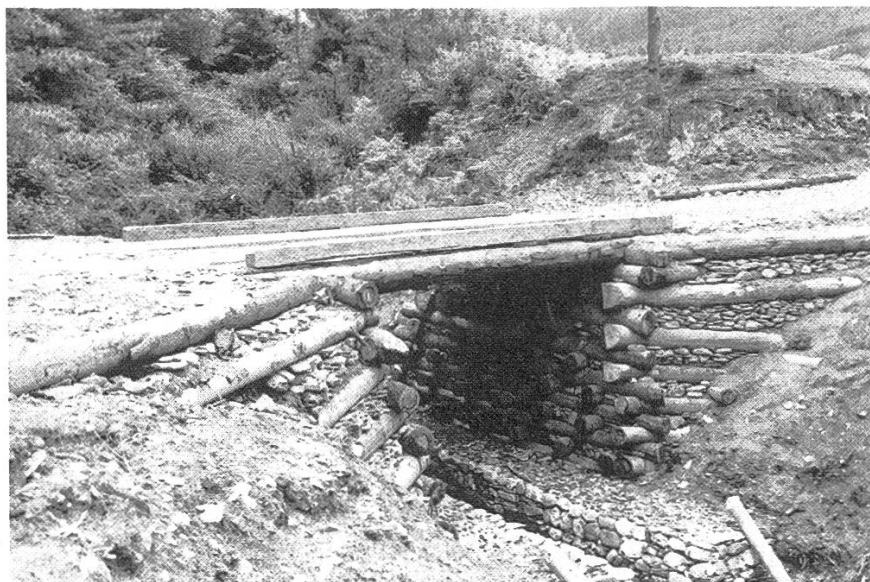
Abbildung 4. Brückenbau mit lokal vorhandenen Materialien.

Das grösste Problem ist die Beschaffung der pro Jahr benötigten 8000 m 3 Trag- und Deckschichtmaterial. Das ursprüngliche Konzept eines permanenten Steinbruches liess sich nicht realisieren, so dass vorwiegend Flussgeschiebe aufbereitet (gebrochen) werden muss, was jedoch während der Regenzeit (Juni bis Oktober) nicht möglich ist.