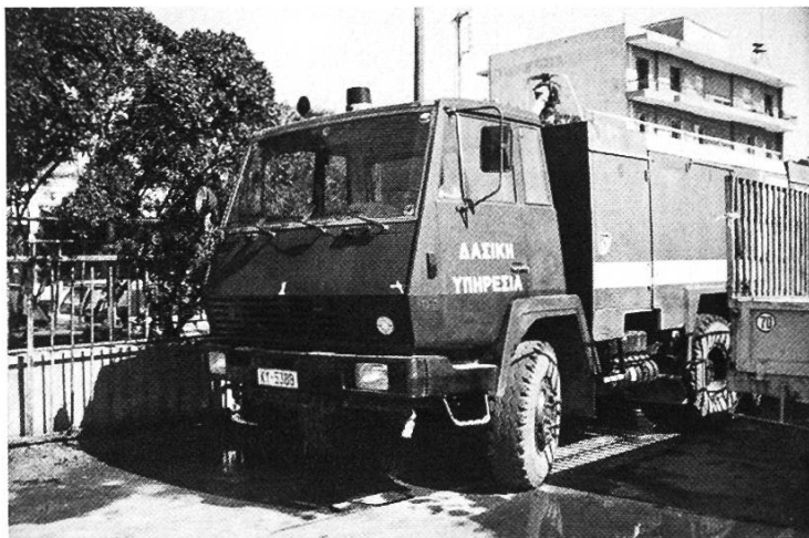
Abbildung 3. Tanklöschfahrzeug der Waldfeuerwehr. Die Bekämpfung von Waldbränden erfolgt durch die dem Forstdienst angegliederte Waldfeuerwehr. Sie ist unabhängig von den örtlichen Feuerwehren und mit eigenem Material ausgerüstet.

Die Bekämpfung von Waldbränden erfordert – sofern es sich nicht um ein kleines, klar abgegrenztes Feuer handelt – eine grosse Zahl von Löschkräften und entsprechend viel Material. Bei den Massnahmen steht die klassische Bekämpfung des Feuers am Boden durch Mannschaften der Waldfeuer-