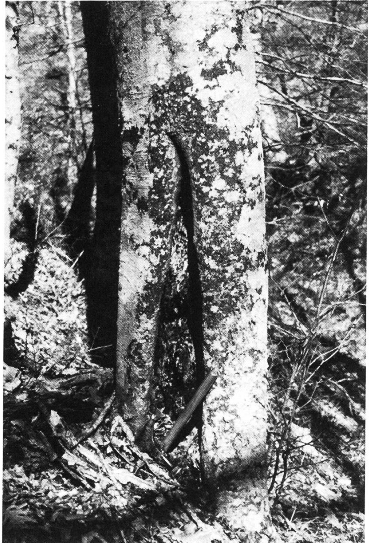
Abbildung 1. Brandschäden an Buchen. Rasch vorbeiziehende Bodenfeuer verursachen an dünnrindigen Bäumen wie dieser Buche Brandschäden. Die geschädigten Stellen werden teilweise zwar überwält, bilden aber Angriffsstellen für Fäulniserreger.

det. Aufgrund von eigenen Beobachtungen konnte ich feststellen, dass in den Buchen/Eichen-Mischwäldern der Halbinsel Chalkidiki rasch durchziehende Bodenfeuer bei den dünnrindigen Buchen Schäden verursachen, während die dickborkigen Eichen vollständig verschont bleiben ( Abbildung 1 ). Sobald ein Feuer an Intensität zunimmt und zum Kronenfeuer wird, sind jedoch auch die Eichen betroffen.