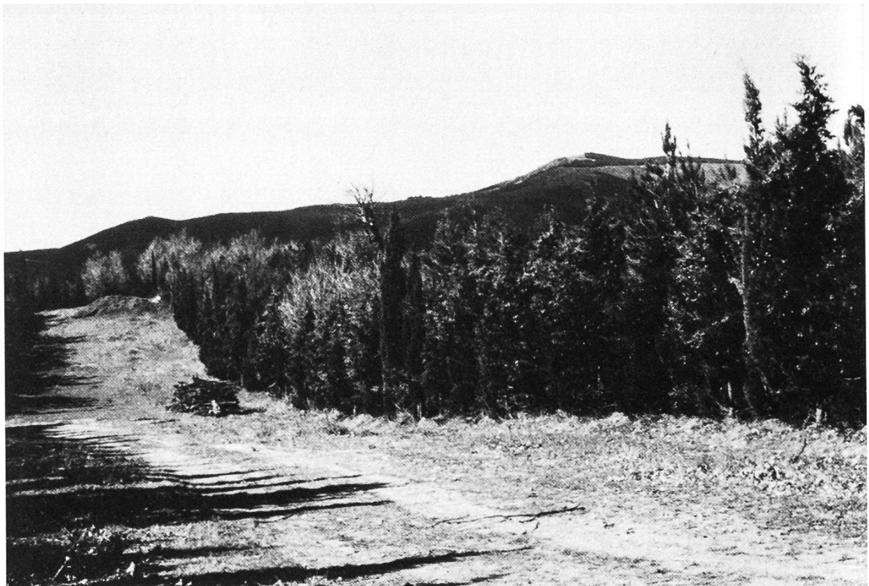
Abbildung 5. Brandschutzstreifen auf Chalkidiki. Damit ein ausgebrochener Waldbrand auf eine kleine Fläche begrenzt bleibt, werden in Aufforstungen Brandschutzstreifen freigehalten, wie hier auf der Halbinsel Chalkidiki. Sie werden an den Rändern mit Zypressen bepflanzt, die weniger rasch Feuer fangen, als andere Baumarten.

haupt innerhalb nützlicher Frist erreicht werden kann, ist das von den ersten Einsatzkräften mitgeführte Wasser spätestens nach 10 bis 15 Minuten aufgebraucht. Sofern die brennende Fläche nicht in Küstennähe liegt, ist es auch nicht möglich, mittels Motorspritzen und Schlauchleitungen den Wassernachschub aufrecht zu erhalten. In solchen Fällen muss die Brandbekämpfung aus der Luft erfolgen. Im Gegensatz zu schweizerischen Verhältnissen spielt dabei der Wasserabwurf durch Helikopter eine untergeordnete Rolle. An ihrer Stelle werden speziell entwickelte Flugzeuge eingesetzt, von denen alle europäischen Mittelmeerländer eine grössere Anzahl besitzen. Es handelt sich dabei mehrheitlich um ein in Kanada hergestelltes, zweimotoriges Hochdecker-Flugzeug, «Wasserbomber» genannt ( Abbildung 4 ). Der zur Zeit erhältliche, weiterentwickelte Typ ist in der Lage, im Gleitflug über einer ebenen Wasserfläche innerhalb 10 Sekunden 6 Tonnen Wasser aufzunehmen und dieses in Form einer grossen Wolke über der Brandfläche auszusprühen. Dadurch werden bei grossflächigen Bränden bessere Resultate erzielt als mit einem Helikopter, der eher für punktförmige, das Feuer zerschlagende Wasserabwürfe geeignet ist.