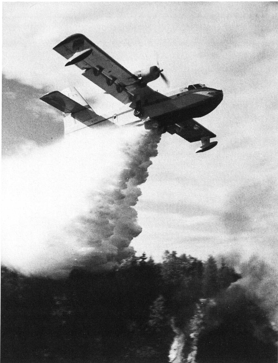
Abbildung 4. Wasserbomber beim Löscheinsatz. Bei grösseren Waldbränden muss die Bekämpfung aus der Luft erfolgen. Die Firma Canadair in Montreal (Kanada) stellt dafür ein spezielles Löschflugzeug her, den Wasserbomber CL-215.

Damit ein Waldbrand erfolgreich vom Boden aus bekämpft werden kann, muss das betroffene Gebiet für die Einsatzkräfte und die Materialtransporte zugänglich sein und genügend Wasser zur Verfügung stehen. Diese Voraussetzungen sind in Griechenland selten erfüllt. Falls die Brandfläche über-