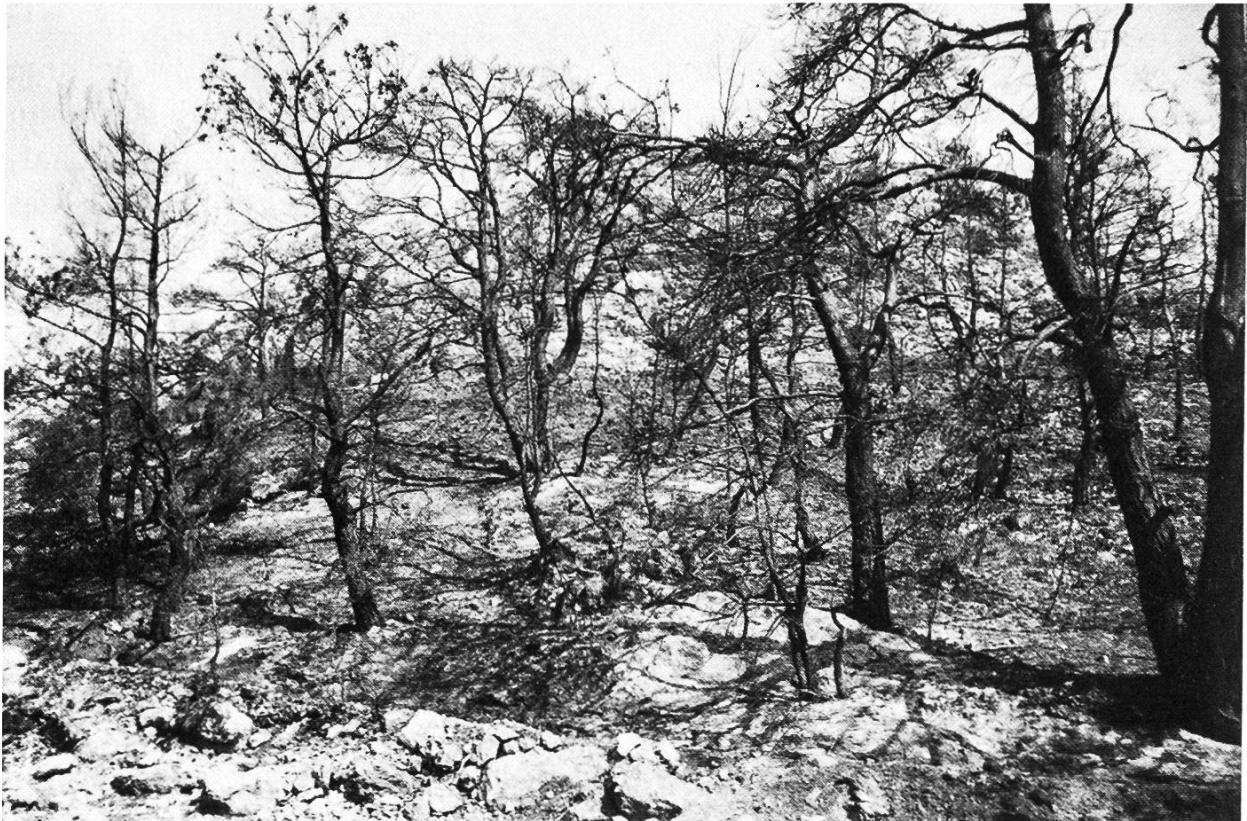
Abbildung 2. Waldbrandfläche auf Chios. Ende Juli 1990 vernichtete ein Waldbrand auf der Insel Chios mehrere hundert Hektaren Föhrenwald, Olivenhaine und Zitrusplantagen.

hingegen wegen der teilweise sehr kleinflächigen Besitzesstruktur in den ländlichen Gegenden Griechenlands. An vielen Orten sind kleine Parzellen mit Wald und landwirtschaftlich genutzte bunt gemischt. Angebaut werden zum grossen Teil Olivenbäume ( Olea europaea L.) oder Zitrusfrüchte, die von einem Feuer genauso betroffen sind wie der umliegende Wald. So vernichtete ein Waldbrand auf der Insel Chios Ende Juli 1990 neben mehreren hundert Hektaren Föhrenwald auch unzählige Olivenhaine und für Chios typische Mastixplantagen ( Pistacia lentiscus L.) (Abbildung 2). Der Verlust für die betroffenen Bauern ist enorm, dauert es doch bei beiden Pflanzenar-